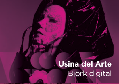
Usina del Arte Björk digital