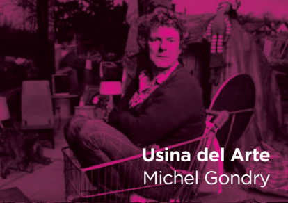
Usina del Arte Michel Gondry