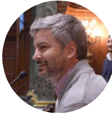
Diego Enrich Director General de Asuntos Legislativos

Una correcta y fluida relación entre el Poder Ejecutivo y el Legislativo es sumamente importante para el adecuado funcionamiento de la Ciudad y para mejorar el día a día de los millones de vecinos que viven, trabajan y estudian en el AMBA.