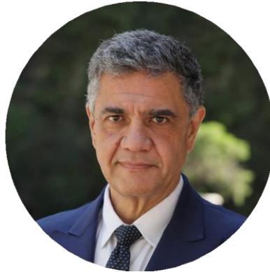
Jorge Macri Ministro de Gobierno

La Legislatura es un gran ejemplo de compromiso y dedicación. En 2022, como cada año, los legisladores estuvieron cerca de los vecinos para escucharlos, contenerlos e impulsar iniciativas que mejoren su vida cotidiana. Eso es muy importante, sobre todo en un momento tan duro como el que nos toca atravesar a todos los argentinos. Nuestro Poder Legislativo es sin dudas un pilar fundamental de la ciudad que queremos construir. Una ciudad en la que todos tengan cada día más y mejores oportunidades.