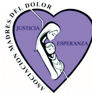
ASOCIACIÓN CIVIL MADRES DEL DOLOR