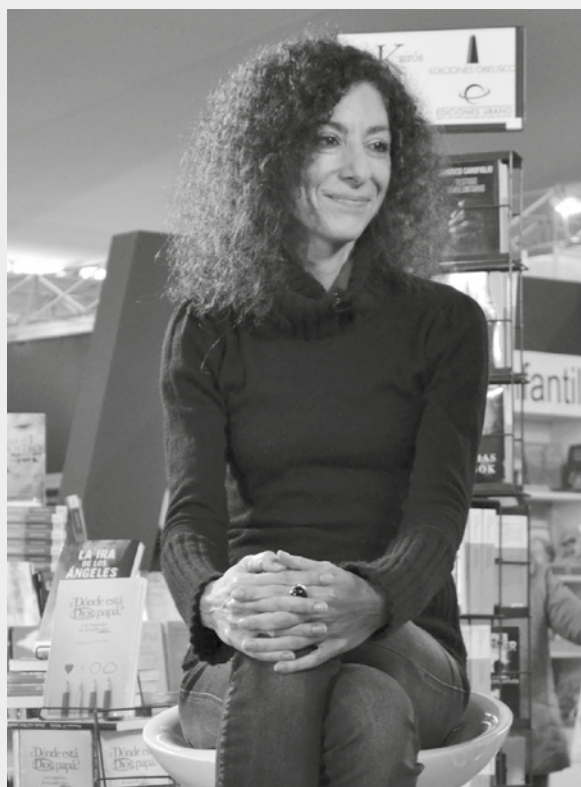
Entrevista extraída de Infobae , 9 de noviembre de 2020 (adaptada con fines didácticos).