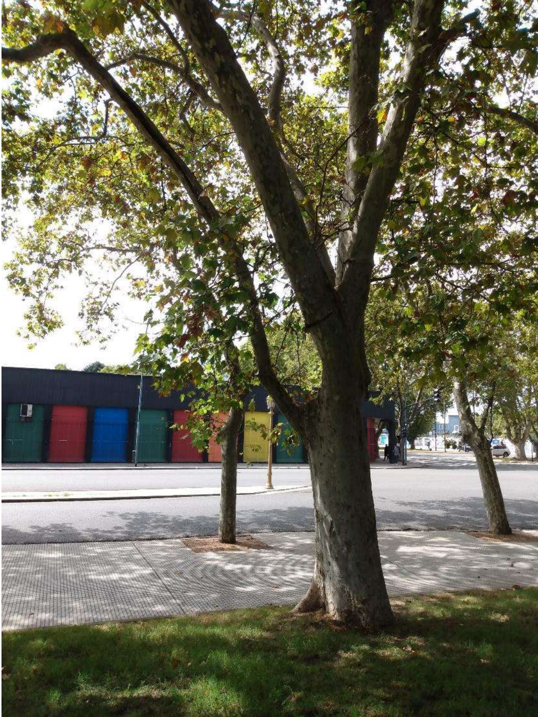
Ejemplar para podar.