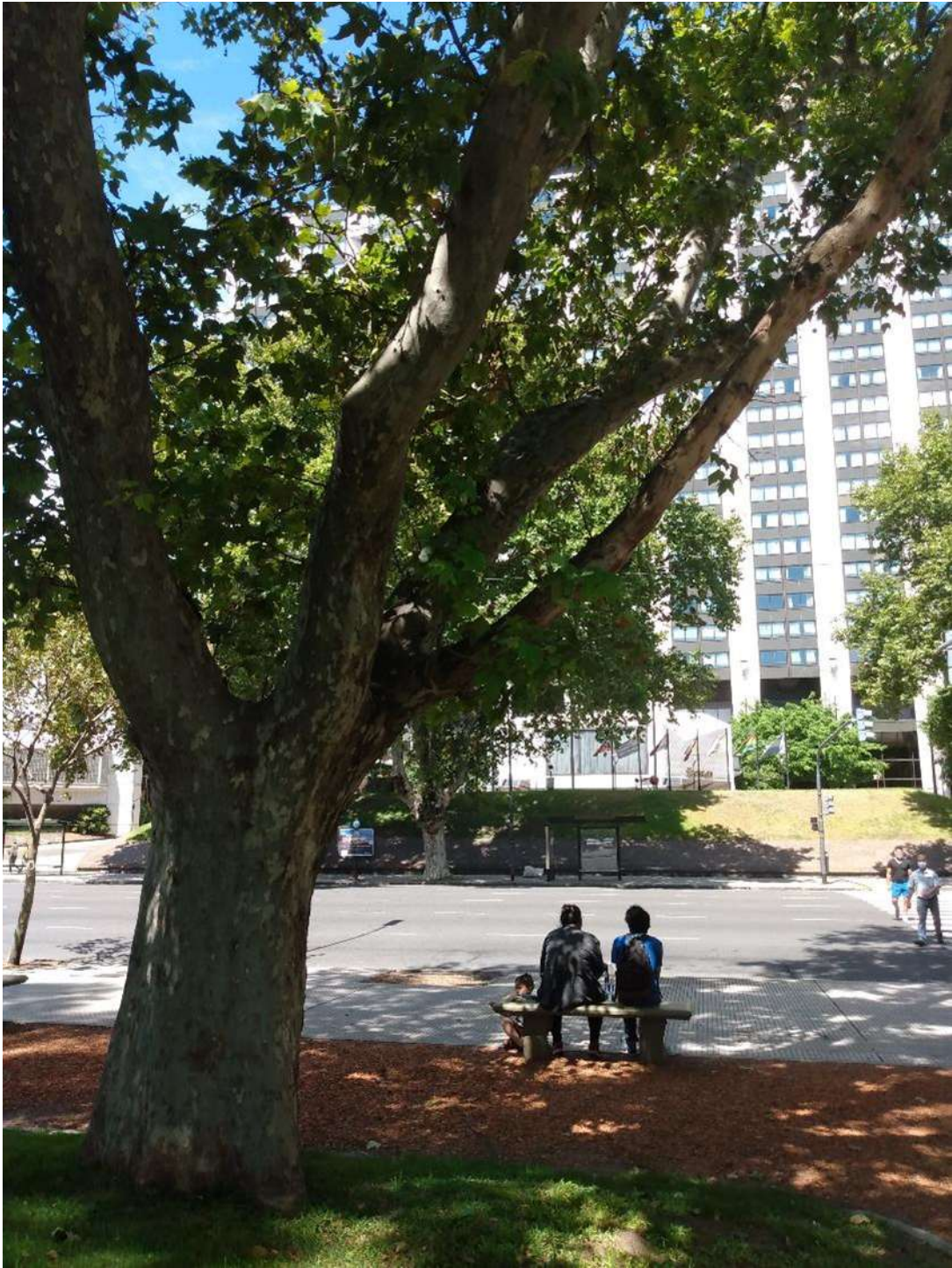
Ejemplar para podar.