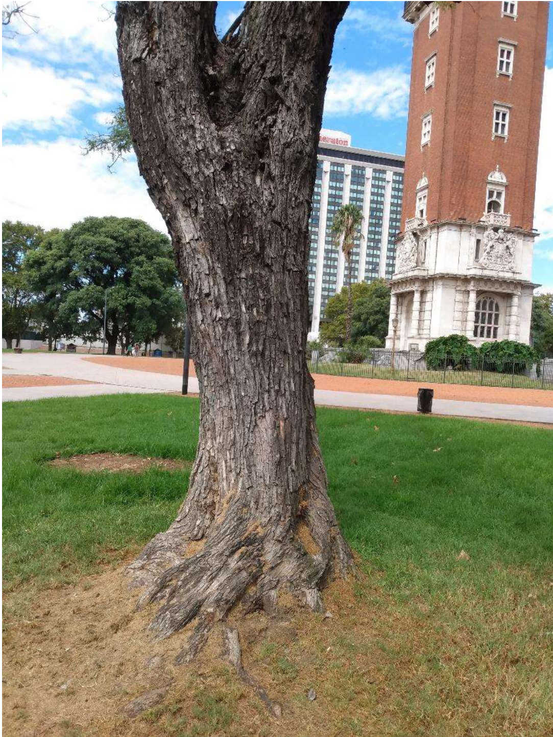
Ejemplar de tipa para podar.