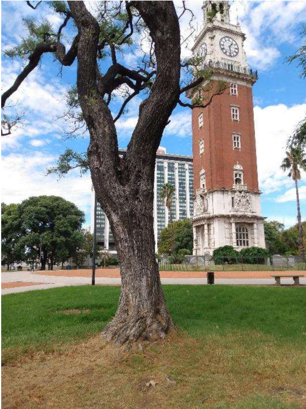
Ejemplar de tipa para podar.