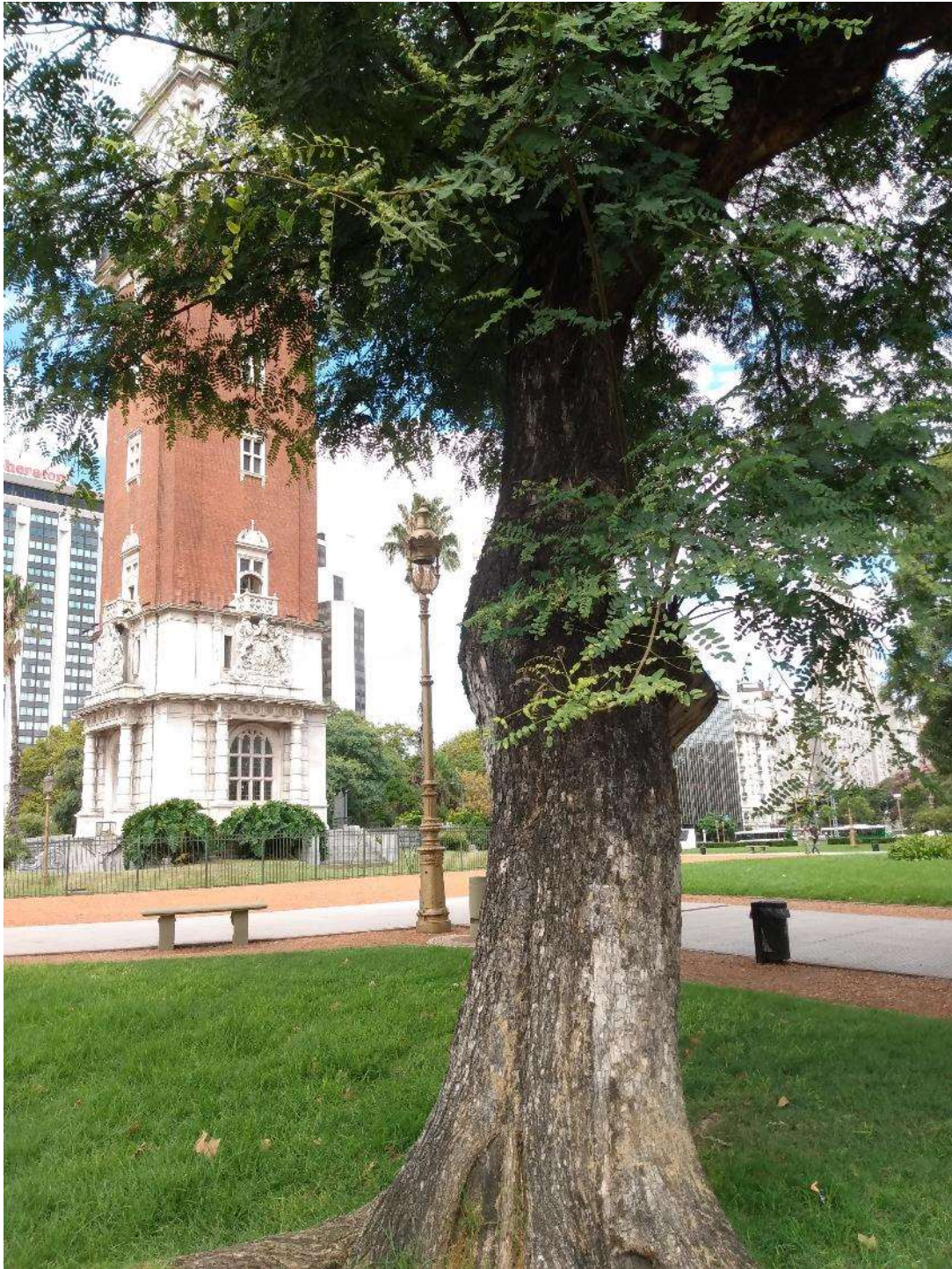
Ejemplar de tipa para podar.