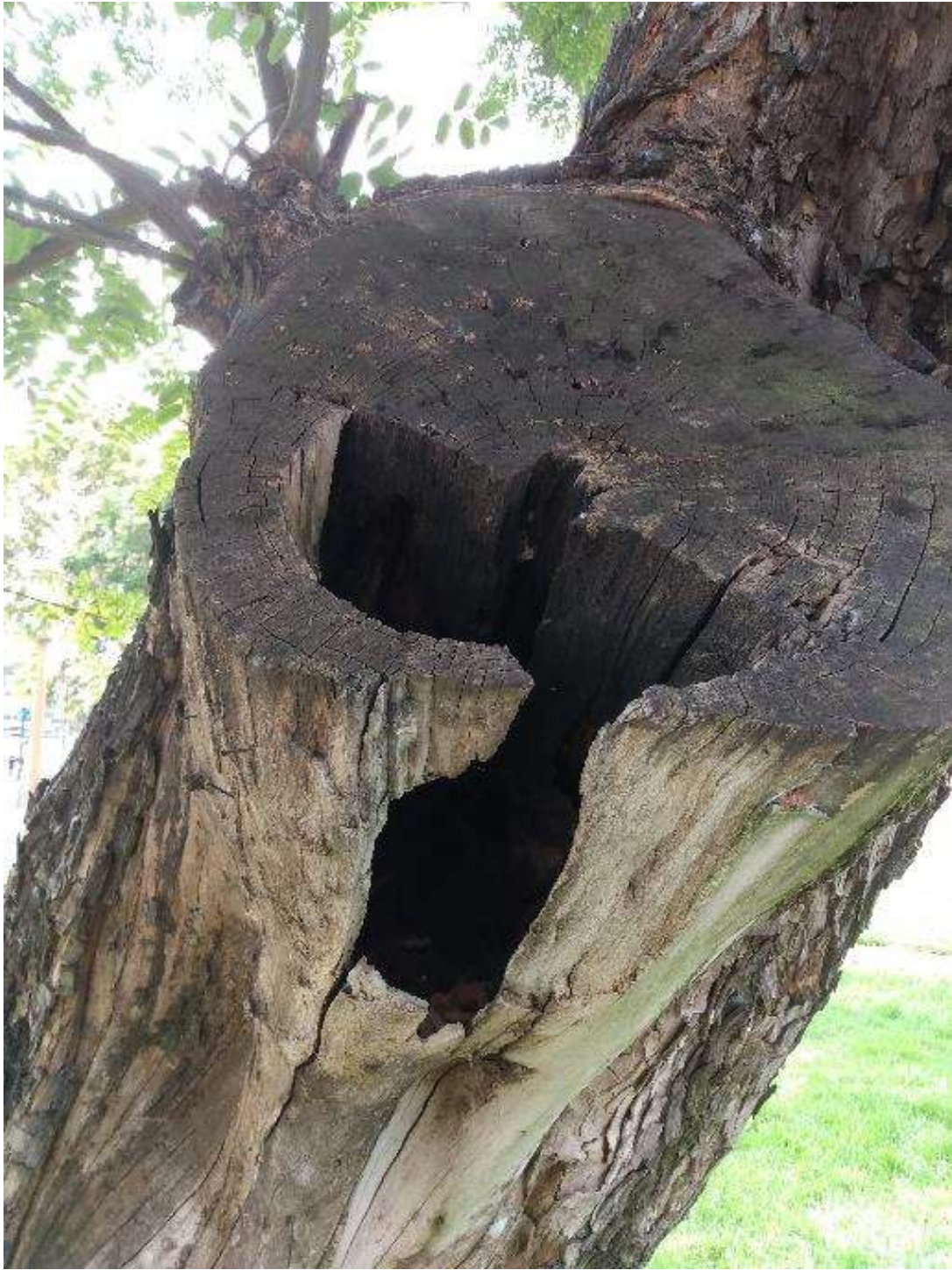
Ejemplar de tipa para podar.