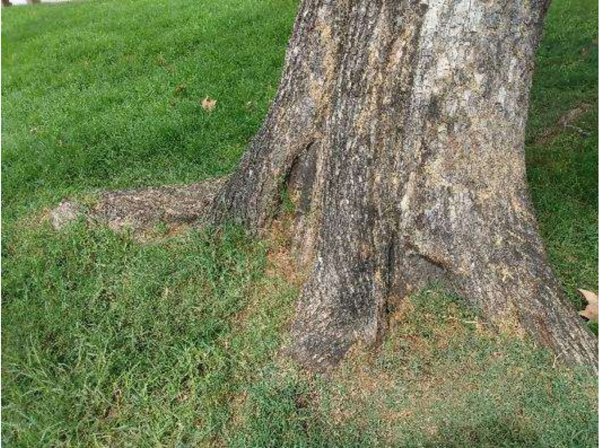
Ejemplar de tipa para podar.