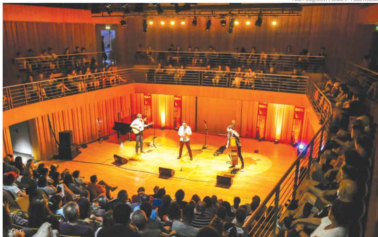
Usina del Arte. Albergará conciertos, masterclasses y clínicas de jazz.

Una vez más, en Buenos Aires se disfrutará la excelencia del jazz, del jueves 2 al domingo 5 de noviembre, con la 16ª edición del Buenos Aires Jazz Festival Internacional. La programación incluye conciertos, masterclasses , clínicas, proyecciones y charlas. La Usina del Arte es la sede principal y alberga los recitales internacionales; mientras el festival también despliega sus actividades en el Cultural San Martín, el Salón Dorado del Teatro Colón, el Museo del Cine, la Vidriera de la DGEART y clubes del circuito de jazz porteño: Bebop, Thelonious, Prez, Jazz Voyeur y el Centro Cultural Nueva Uriarte.