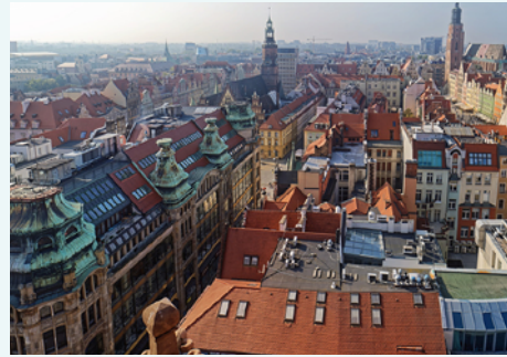
Mazzoncini, Esteban. Un viajero curioso . Buenos Aires: Edición del Autor, 2016. (Fragmento adaptado)

Salgo con ella y me subo al auto de su familia, sin saber hacia dónde me dirijo. Después de un poco más de una hora de viaje, llegamos a su casa de campo donde los preparativos para algún tipo de evento importante están a pleno. No entiendo lo que sucede hasta que Anna se acerca y me comenta que seré el invitado especial para su casamiento de mañana. Un primo me presta un traje y estoy a tono con el evento. Disfruto allí de tres días mágicos hasta que los recién casados parten en su luna de miel por Sudamérica.