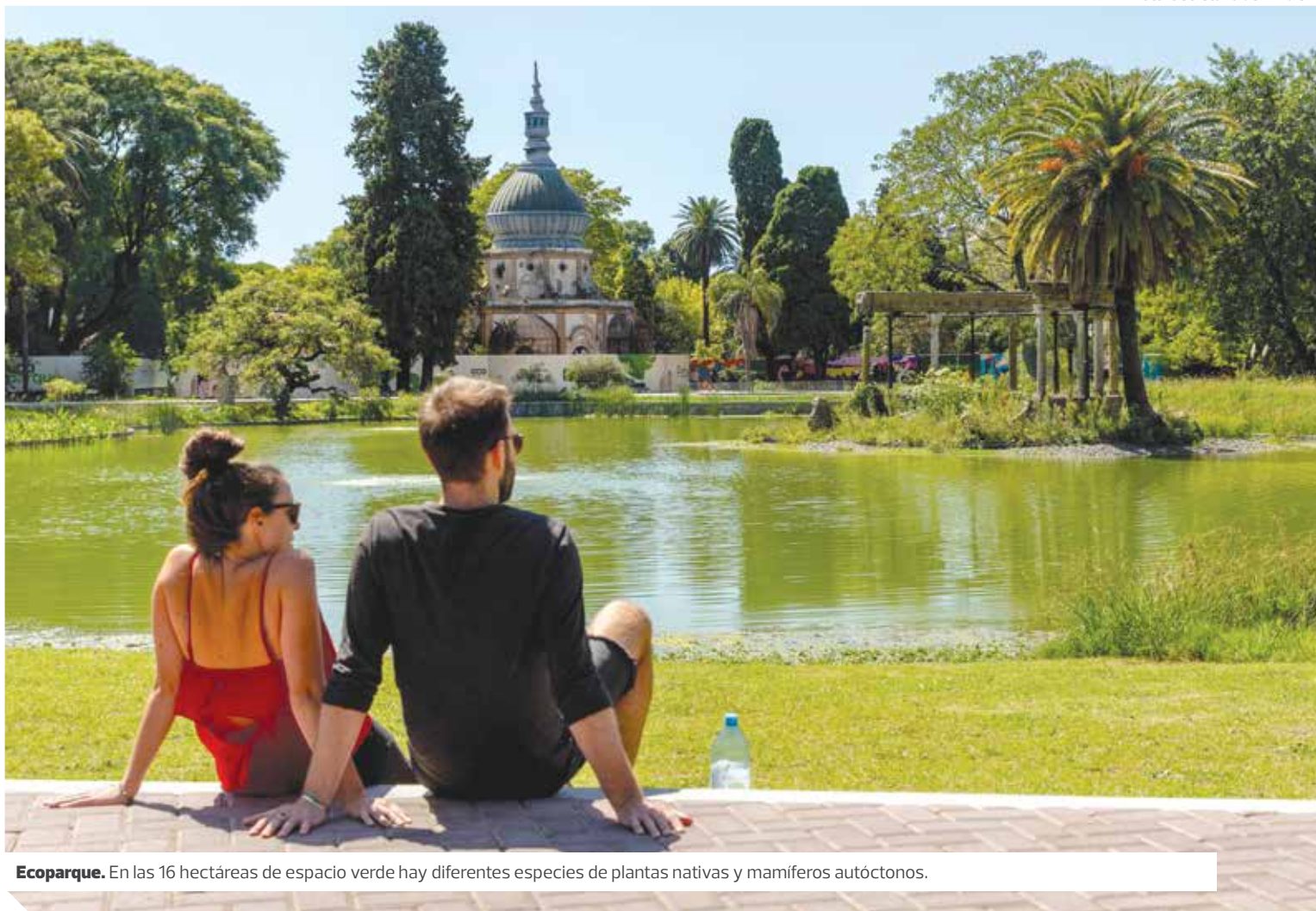
Ecoparque. En las 16 hectáreas de espacio verde hay diferentes especies de plantas nativas y mamíferos autóctonos.