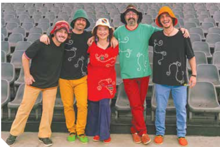
Grupo Cielo Arriba. Presenta Canciones Jugadas , el domingo 12, a las 17 h.