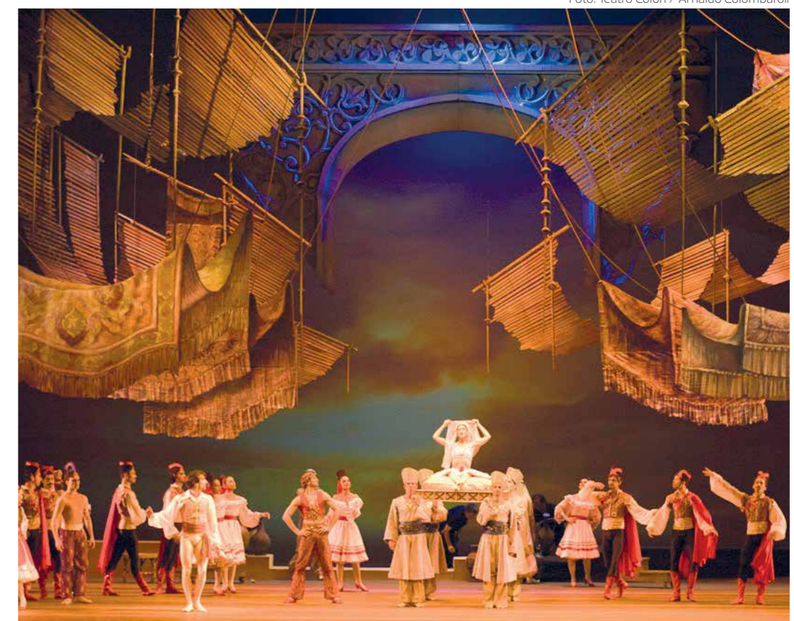
El Corsario. El notable ballet inspirado en el célebre poema de Lord Byron estrena el 17 de diciembre.

Es una notable pieza que aborda temas como la paranoia, la historia y, desde ya, la propia literatura argentina, con alusiones a Domingo Faustino Sarmiento, Rodolfo Walsh, Roberto Arlt, y la figura del inventor al borde del delirio. Hay un guardián de un extraño museo y, también, un investigador que intenta develar la