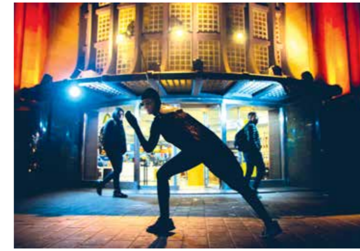
Sitio específico. DJ Cucaracha , Callejón Espacial y Yo de piel son parte de la programación.

Se pueden ver últimas funciones de obras significativas que habitan una frontera entre diversas artes, tales como Yo de piel , de Leticia Mazur –del jueves 30 al domingo 3, a las 18.30 h., en el Parque de la Estación (Tte. Gral. Juan Domingo Perón 3326)–. Es un trabajo inédito