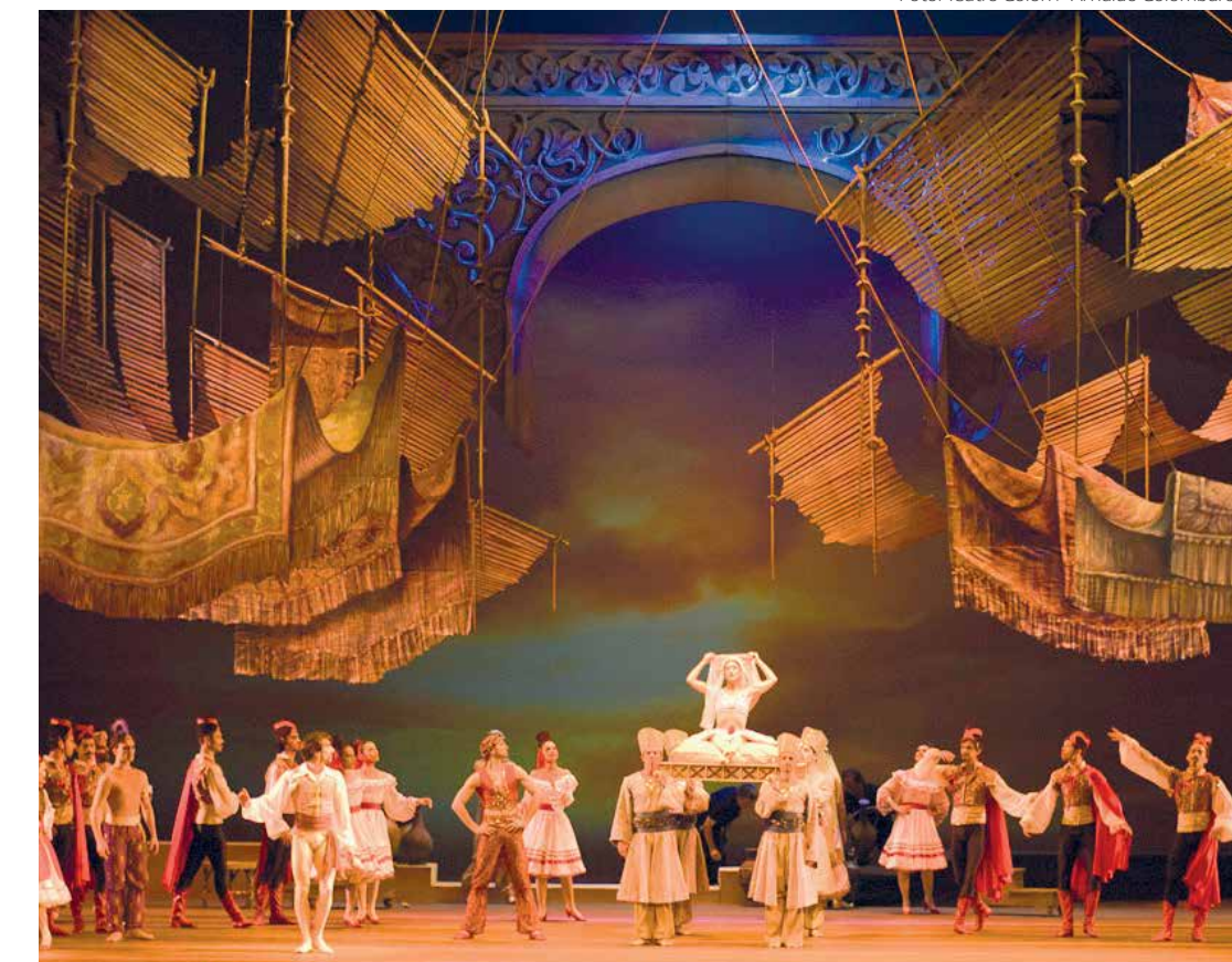
El Corsario. El notable ballet inspirado en el célebre poema de Lord Byron estrena el 17 de diciembre.

Es una notable pieza que aborda temas como la paranoia, la historia y, desde ya, la propia literatura argentina, con alusiones a Domingo Faustino Sarmiento, Rodolfo Walsh, Roberto Arlt, y la figura del inventor al borde del delirio. Hay un guardián de un extraño museo y, también, un investigador que intenta develar la