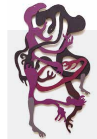
Marcas vinculares. La obra de Rocky Cervini iundaga en el padecimiento.

Hay otras, como Cómo atrapar una estrella fugaz , de Laila Balde-