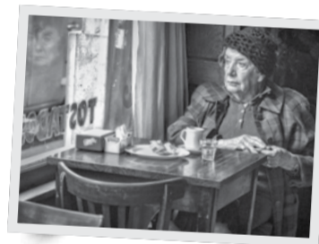
República de Waires.