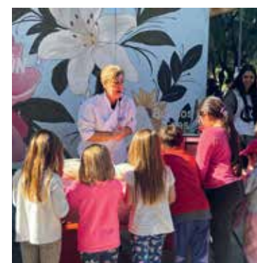
Alimentación. Los talleres ofrecen recetas sanas y prácticas.

Por otro lado, la propuesta es aprender a alimentarse mejor, con opciones sanas y frescas, acordes con esta estación. Con clases de cocina dictadas por diferentes chefs, el objetivo es llevarse recetas prácticas y fáciles para ha-