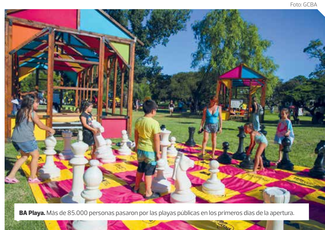
BA Playa. Más de 85.000 personas pasaron por las playas públicas en los primeros días de la apertura.