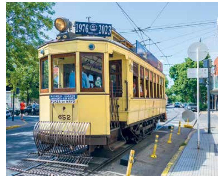
Caballito. El viaje dura 15 minutos y se combina con una visita al museo Centenera.

Hace años, Metrovías les cedió las vías del tranvía histórico para que los coches puedan circular sin costo y, como complemento perfecto, el Museo del Subte Centenera, en Centenera 777, permite conocer el proceso de restauración de murales, la reproducción de piezas patrimoniales y la conser-