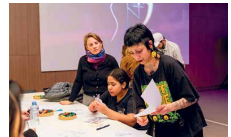
Talleres. Dibujo y reciclado son algunas de las propuestas para los más chicos.

Un recorrido por la exposición, que recorre las memorias del 2001, para personas con discapacidad visual y público general. Es el sábado 27, a las 16.