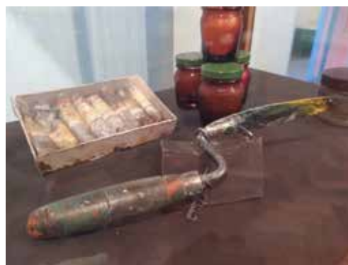
“Espátula y pinturas”