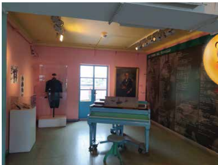
“La Orden del Tornillo”