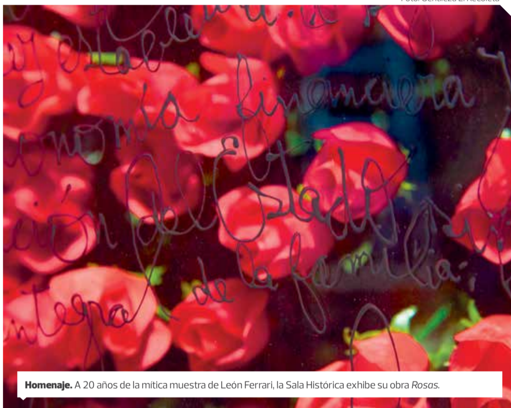
Homenaje. A 20 años de la mítica muestra de León Ferrari, la Sala Histórica exhibe su obra Rosas .

En Centinelas (Sala 4) , la primera exposición individual en Buenos Aires de Victoria Liguori