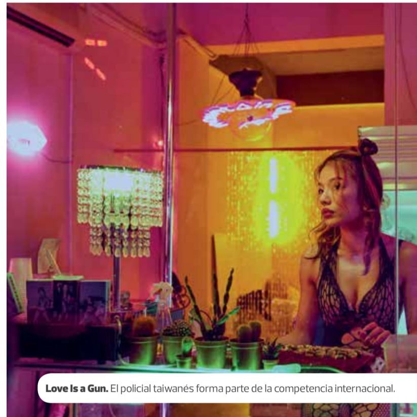
Love Is a Gun. El policial taiwanés forma parte de la competencia internacional.