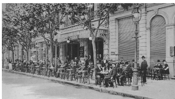
El Café Tortoni en 1926.

Entre los establecimientos gastronómicos de la gran arteria, se destacan el Café Los 36 Billares (n° 1271) y el Tortoni, el café más antiguo de la ciudad, que en primera