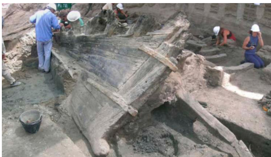
Hallazgo del pecio español en Buenos Aires. Fuente: DGPMYCH.

La Ciudad de Buenos Aires tiene una concepción inclusiva y participativa de su patrimonio considerándolo, no solo nexo fundamental entre el ciudadano y su identidad, sino también factor de desarrollo social, económico y turístico.