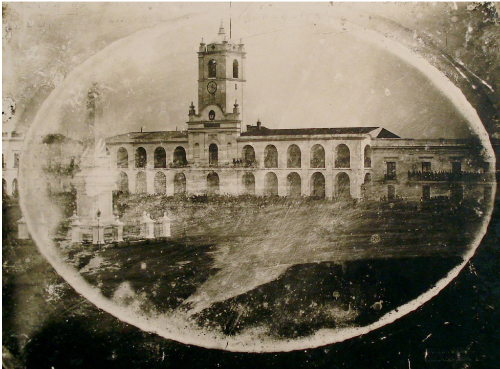
Daguerrotipo del Cabildo hacia 1850.

En el interior del edificio que fuera del Cabildo funciona un museo dedicado a la Revolución de Mayo, que fue el comienzo de nuestra independencia y que tuvo epicentro en ese lugar. Está custodiado permanentemente por una guardia del Regimiento de Patricios.