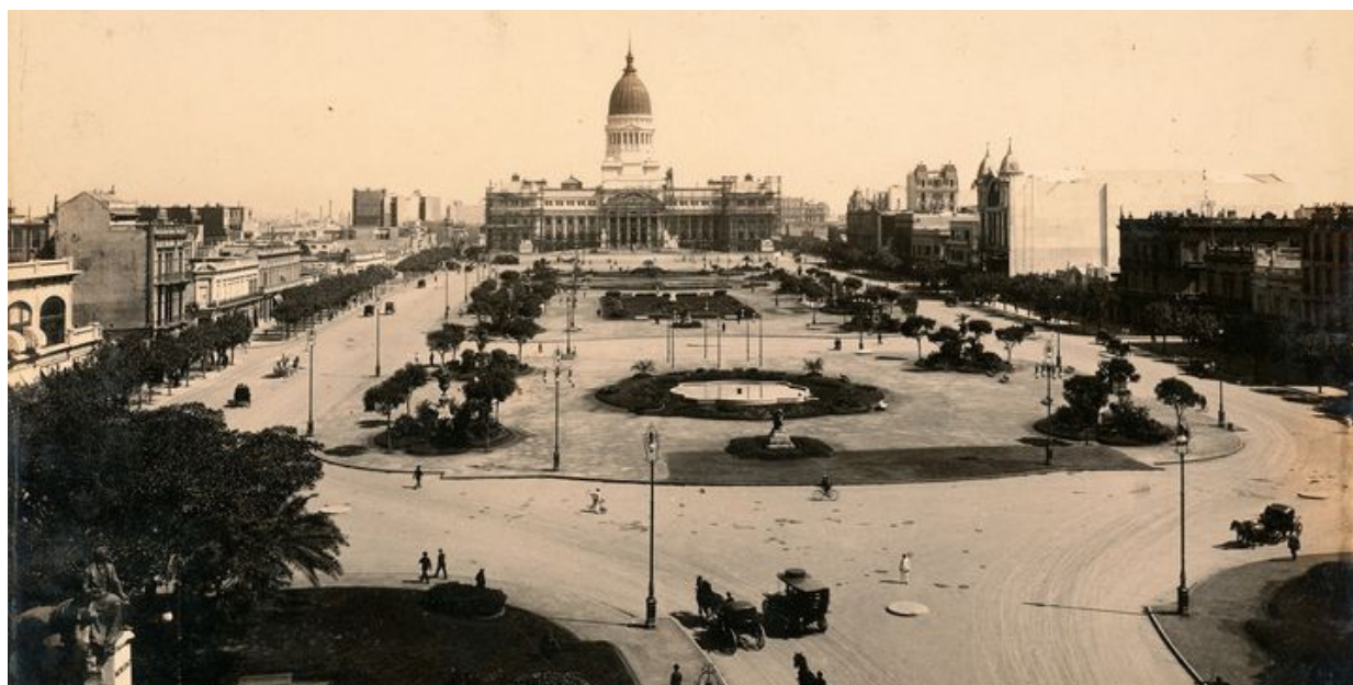
Plaza del Congreso.

Frente a la Plaza del Congreso, en Av. Rivadavia 1745 se levanta un edificio construido por Atilio Locati para el Instituto Biológico Argentino (hoy allí funciona la Auditoría General de la Nación). Está rematado por dos figuras humanas de bronce de cuatro toneladas que dan las horas golpeando una campana con sendos martillos.