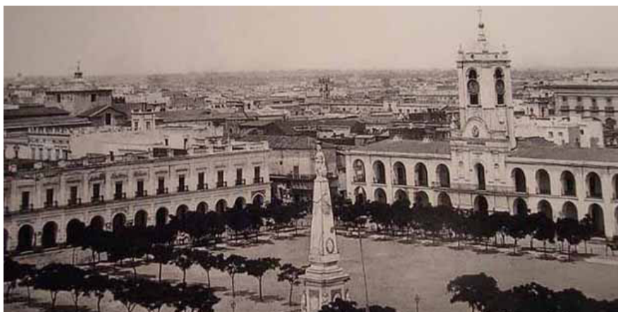
Plaza de Mayo, 1867.

Incluye: Patrimonio Cultural Mueble (pinturas, esculturas, manuscritos, material filmico, objetos, restos arqueológicos, entre otros); Patrimonio Inmueble (monumentos, sitios, lugares o jardines históricos, jardines y sitios arqueológicos, etcétera).