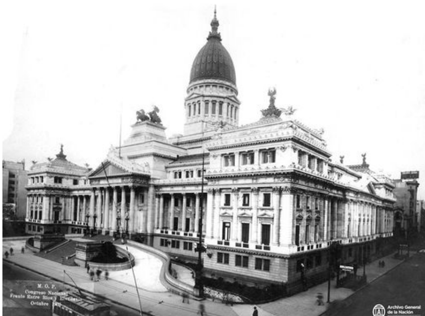
Palacio del Congreso.

La Plaza del Congreso se abrió cuatro años más tarde de la habilitación del Palacio, en 1910. En el centro de la