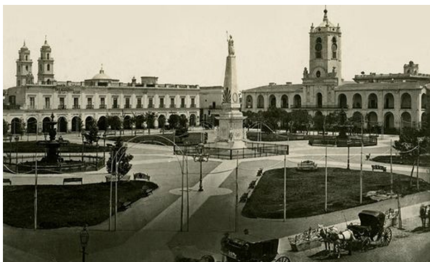
La Plaza, el Cabildo y la Pirámide de Mayo, en 1881.

Hacia 1810 la cuadra de Hipólito Yrigoyen entre Bolívar y Defensa era la más comercial de la ciudad: tenía una vereda muy amplia y por eso se la conocía como “la vereda ancha”. Fue en una de sus tiendas que French y Beruti compraron las cintas identificatorias de la Semana de Mayo. Posteriormente, en 1818 se decidió que los edificios de esa cuadra debían tener una recova. Si bien esta se mantiene hasta el día de hoy, los edificios ya son otros, más nuevos y altos. Esta recova, conocida como “Recova nueva” (para diferenciarla de la “vieja”) fue el lugar donde se ubicaron los vendedores “bandoleros” que allí instalaban sus “bandolas”, muebles compuestos por un cajón con pies y tapa en los que por lo general vendían mercaderías o chucherías (peines, rosarios, dedales, collares, etc.).