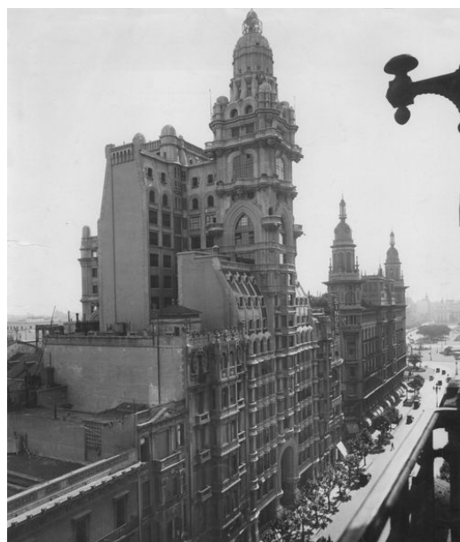
La Avenida de Mayo en las primeras décadas de siglo XX.