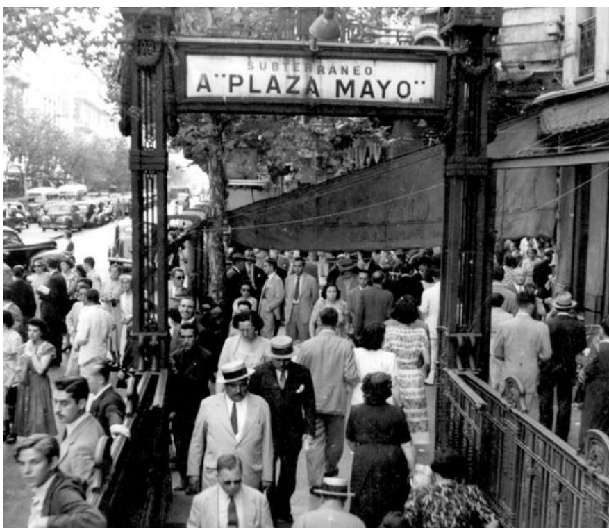
El primer Subterráneo.

La Avenida de Mayo tiene una marcada influencia hispana. Bares, restaurantes, hoteles y el Teatro Avenida llevan la impronta de la colectividad española desde principios del siglo pasado. No por nada se la compara con la Gran Vía madrileña. Tiene además un enorme valor intangible por ser la vía institucional de la Nación, que une el Poder Ejecutivo con el Poder Legislativo. En ese sentido es el camino obligado de asunción de todos los presidentes constitucionales y escenario de las diferentes manifestaciones populares y políticas, tanto de protesta como festivas. Su importancia llevó a que en 1997 se la declarara como Lugar Histórico Nacional.