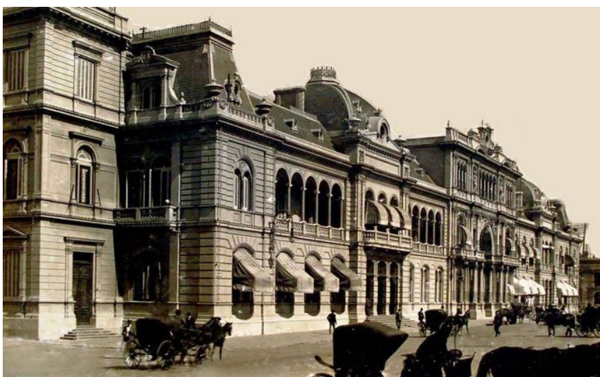
La Casa Rosada a fines de siglo XIX.

“Casa Rosada” es el nombre que tradicionalmente se le da a la Casa del Gobierno Nacional y lleva ese nombre, porque desde que Domingo F. Sarmiento fue presidente está pintada de rosado. Hay quienes dicen que fue porque se usó pintura mezclada con sangre de cerdo. Otros, sostienen que Sarmiento quiso conciliar los colores rojo y blanco, que simbolizaban de alguna manera a los federales y los unitarios, partidos políticos predominantes hasta unos años antes.