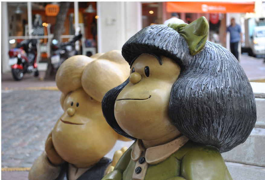
Mafalda. Patrimonio Inmaterial de Buenos Aires.