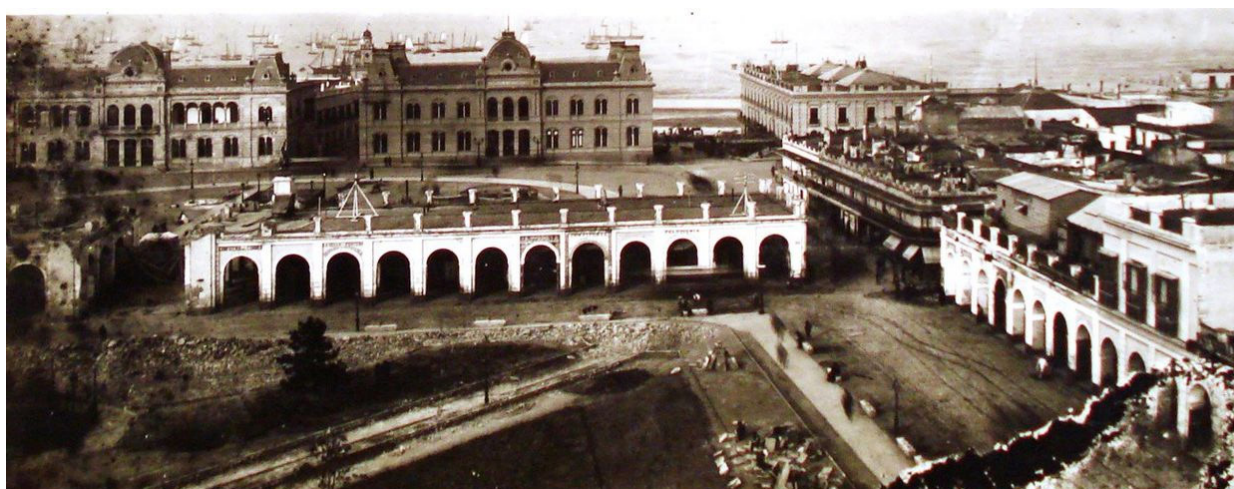
Vista de la Recova Vieja antes de su demolición, en 1883.

Ya entrado el siglo XIX las dos plazas fueron adornadas con árboles y bancos. Cuando en 1883 se decidió la demolición de la Recova y su posterior unificación, fue