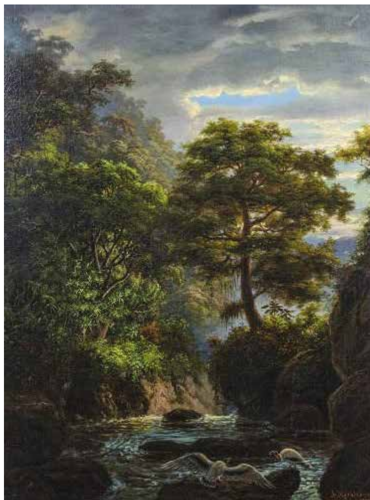
Quebrada debajo de la ensenada con cóndores y un pino, ca. 1877/1884. Óleo sobre tela. 62 x 46,8 cm. Colección privada