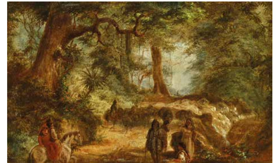
Selva tucumana , ca. 1877/1884. Óleo sobre cartón. 19,3 x 31,5 cm. Colección privada