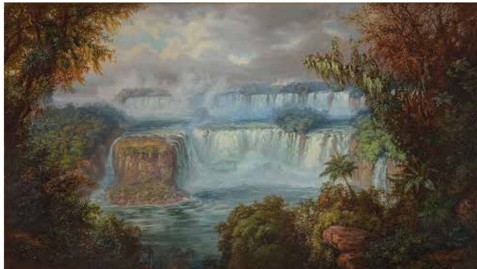
Cataratas del Iguazú , ca. 1893. Óleo. 87,8 x 156 cm. Colección privada Imagen de tapa: Garzas blancas en el Alto Paraná , 1892. Óleo sobre tela. Colección privada