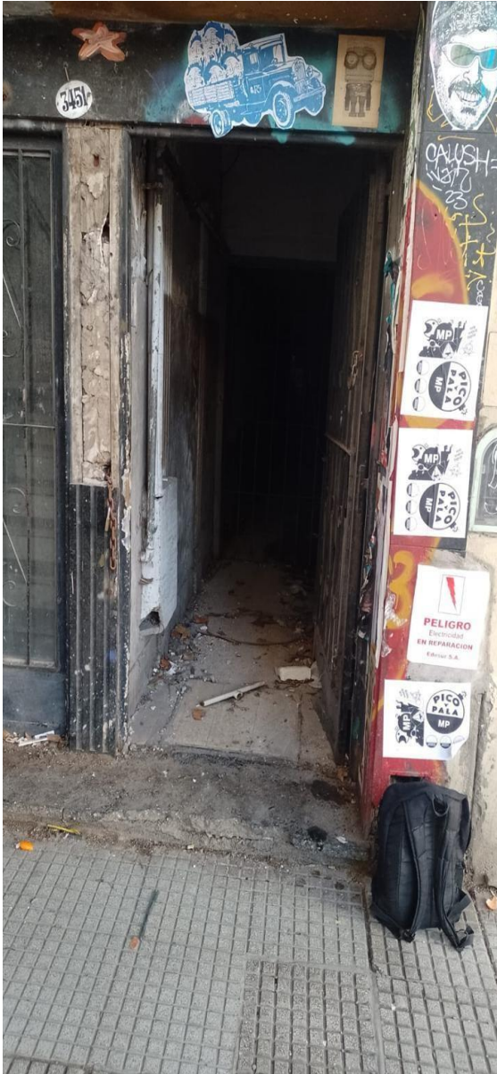
Frente Corrientes 3451