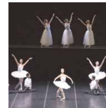
Ballet. El viernes 30 estrena un programa mixto.

La ópera, cuyo estreno mundial está previsto para el jueves 22 de agosto a las 21 h. en el Centro de Experimentación del Teatro Colón (Viamonte 1168), une los tiempos y liga el mito con el presente. Se trata de una coproducción entre el Alternative Stage de la Ópera Nacional de Grecia y el Centro de Experimentación del Teatro Colón y la puesta en escena es de Alexandros Efklidis y Diana Theocharidis, directora del CETC. Las funciones son los viernes 23 y 30 y el sábado 31 a las 20 h. y