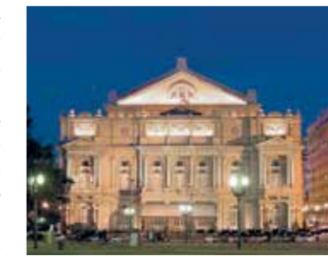
Teatro Colón. Presenta dos grandes conciertos internacionales.