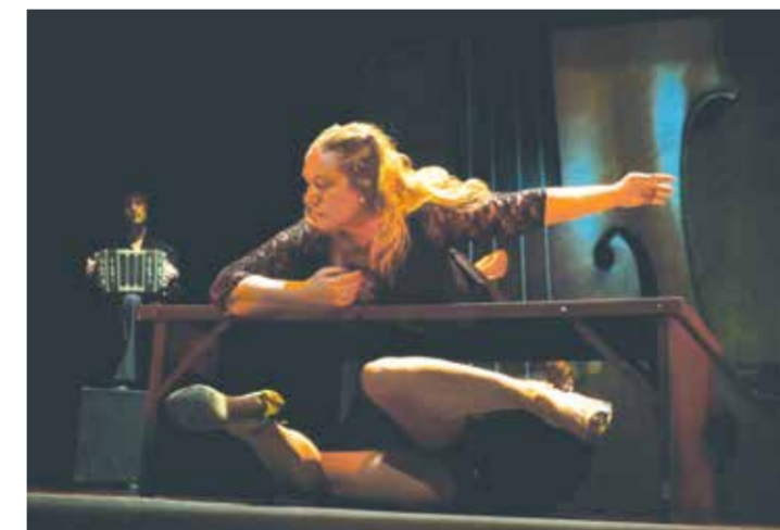
Fusión In the bodies. Un innovador espectáculo coreográfico llega a El Cultural.

trada sin costo y por orden de llegada hasta completar la capacidad de la sala: allí, será tiempo de bailar, sin importar el nivel ni la destreza adquiridos. Además, el sábado 24 la Ciudad celebra los 154 años del Barrio de La Boca -que se cumplen el día 23- con una tertulia en Barraca Peña dedicada al tango: la cita es desde las 14.30 h., con un cupo de 40 personas por orden de llegada, en Av. Pedro de Mendoza 3003 (no se suspende por lluvia). En tanto, el martes 27, a las 14 h, se llevará a cabo un recorrido por