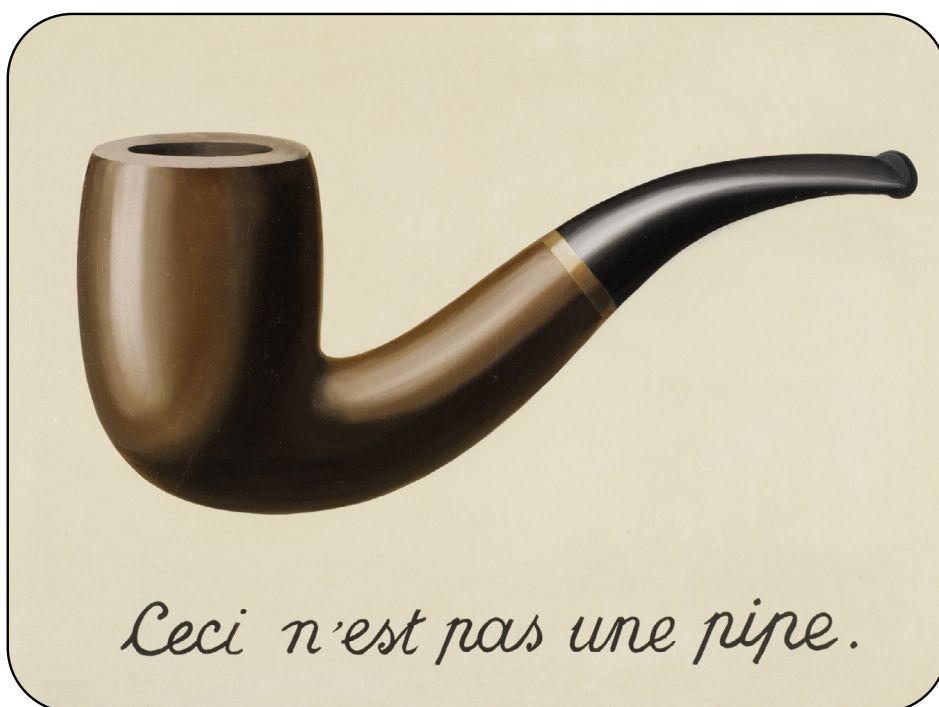
La traición de las imágenes , René Magritte, 1929.

En el apartado 4, “¿Cómo planificar el trabajo conjunto?”, se presentarán algunas estrategias para llevar a cabo esta tarea. Pero antes, analicemos situaciones didácticas posibles que respondan a esta propuesta, sin olvidar que el mapa no es el territorio. Como se suele decir, podemos elaborar mapas cada vez más certeros del territorio que esperamos cartografiar. Sin embargo, la realidad es una materia que escapa a la representación, se esconde siempre un poco, deja en evidencia que lo real solo se alcanza habitando lo real. Cuando vayamos al territorio, nos encontraremos con que el mapa resulta una verdad a medias, y que debemos avanzar haciendo pie en lo que realmente sucede. Después de todo, ya lo dijo Magritte en 1929, en La traición de las imágenes , una obra revolucionaria que complejiza la relación entre la realidad y su representación.