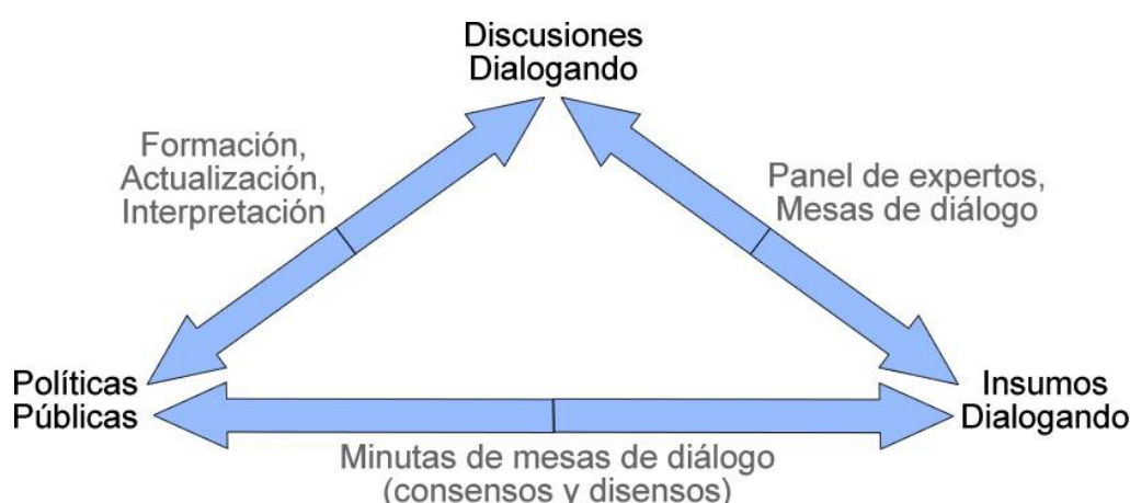
Gráfico 1: Flujograma del Dialogando BA

El Dialogando BA puede tener como objeto la creación, actualización o interpretación de una política pública o marco normativo específico. Por ejemplo, las tres primeras sesiones del Dialogando sobre Acceso a la información (2016) se enfocaron en aspectos de la normativa a desarrollar, y el cuarto, en su implementación. Por su parte, el Dialogando de Nueva Normativa del Registro del Estado Civil y Capacidad de las Personas de la Ciudad de Buenos Aires (2017-18), si bien se enfocó en la co-creación de normativa, partió de discusiones sobre la interpretación de la legislación existente.