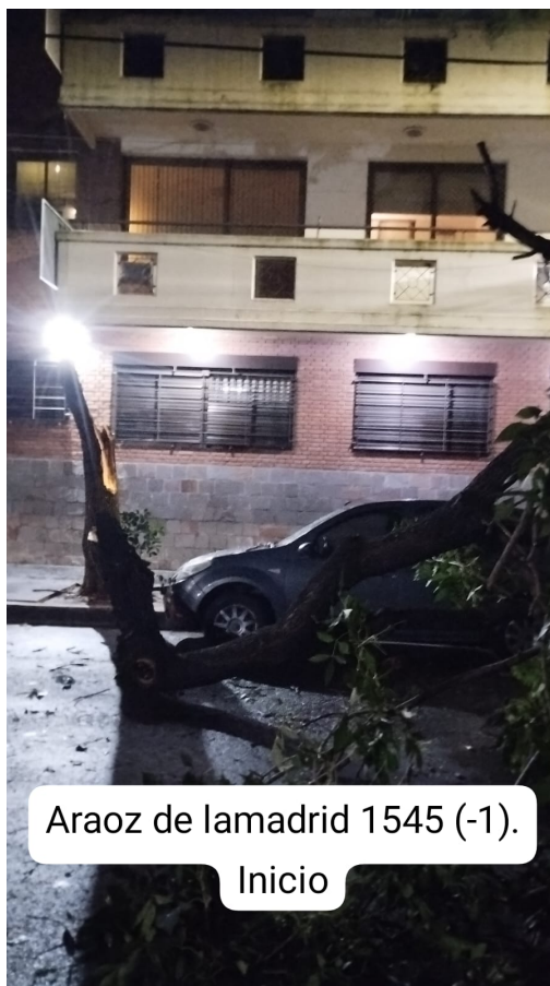
Araoz de lamadrid 1545 (-1).