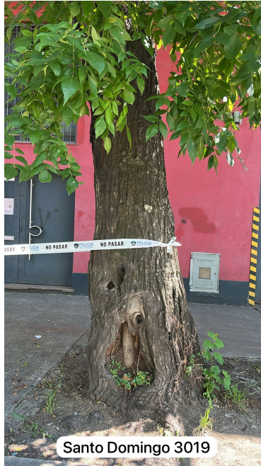
Santo Domingo 3019