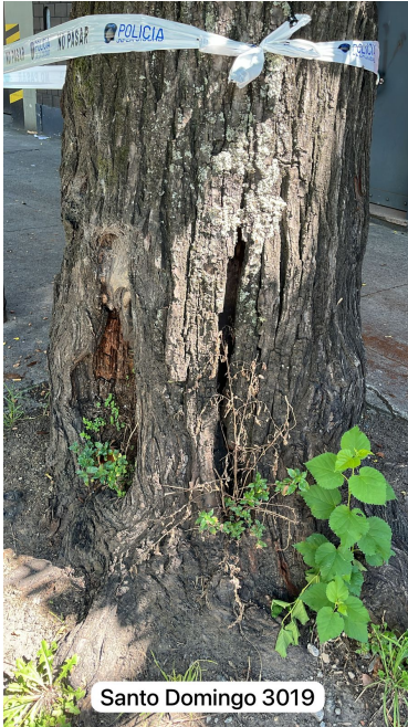
Santo Domingo 3019