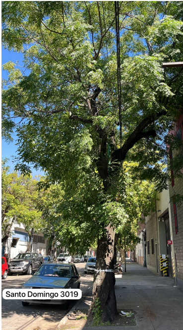
Santo Domingo 3019