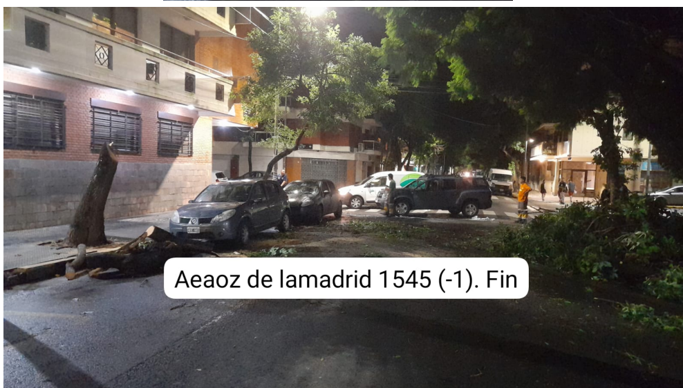
Aeaoz de lamadrid 1545 (-1). Fin