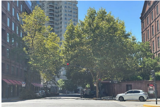
Martha Salotti 400