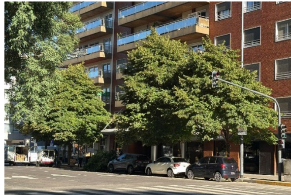
Azucena Villaflor 300 (lado par)