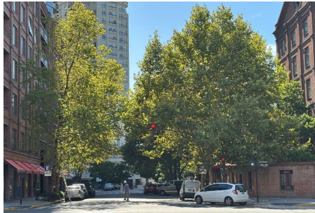
Martha Salotti 400