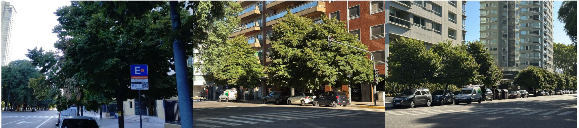
Azucena Villaflor 400-500 (lado par)