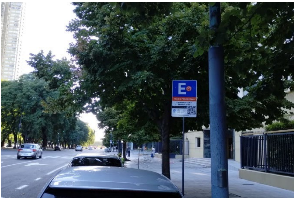
Azucena Villaflor 301 (lado impar)