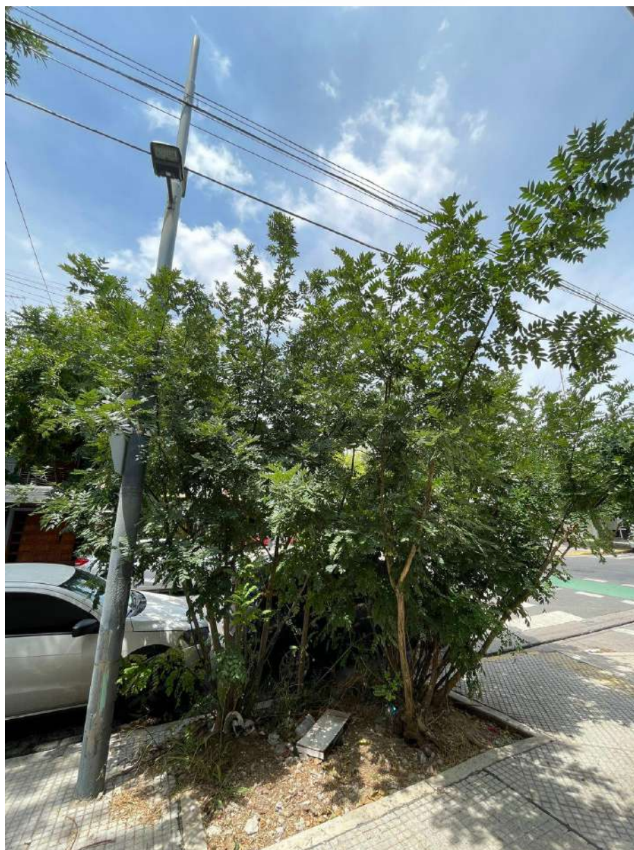
IMAGEN DEL EJEMPLAR