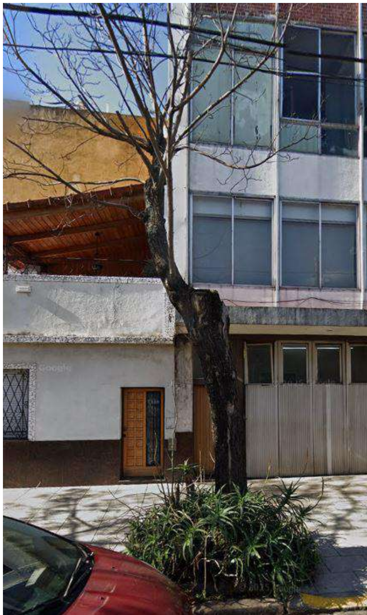
IMAGEN DEL EJEMPLAR