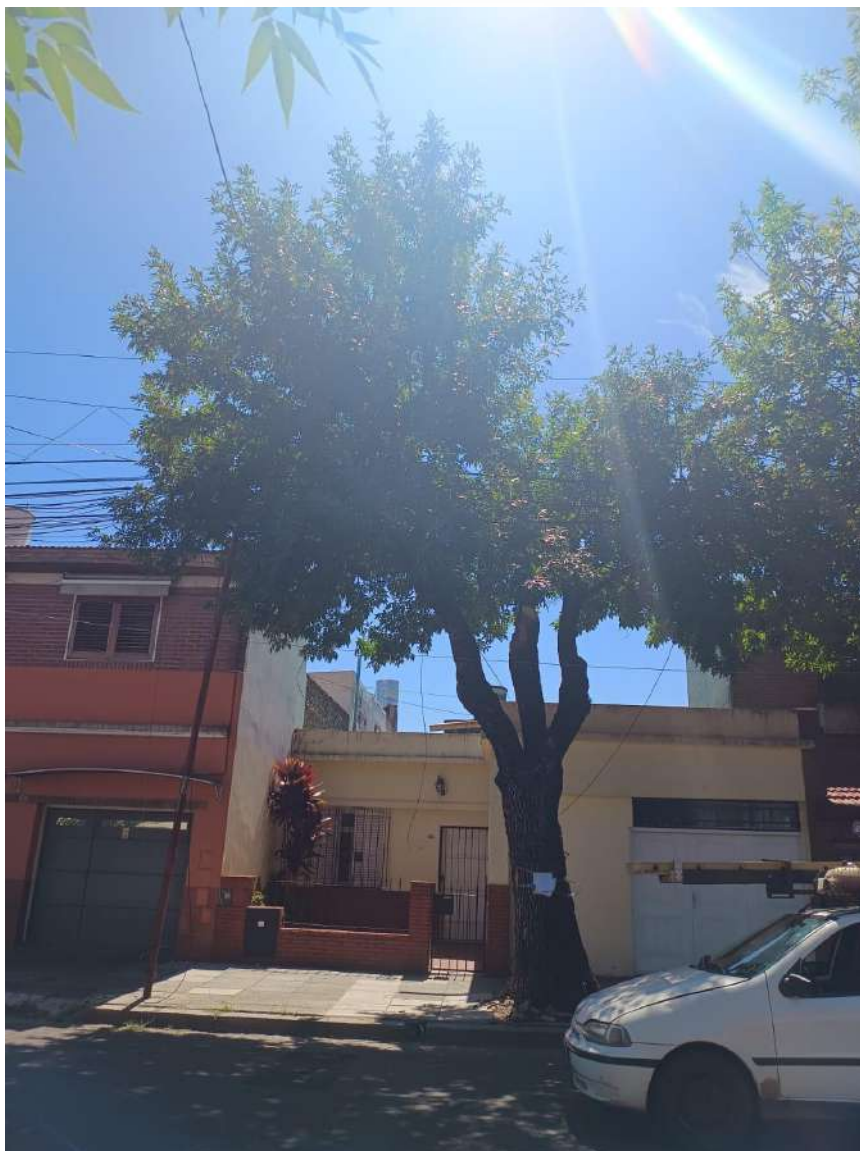
IMAGEN DEL EJEMPLAR