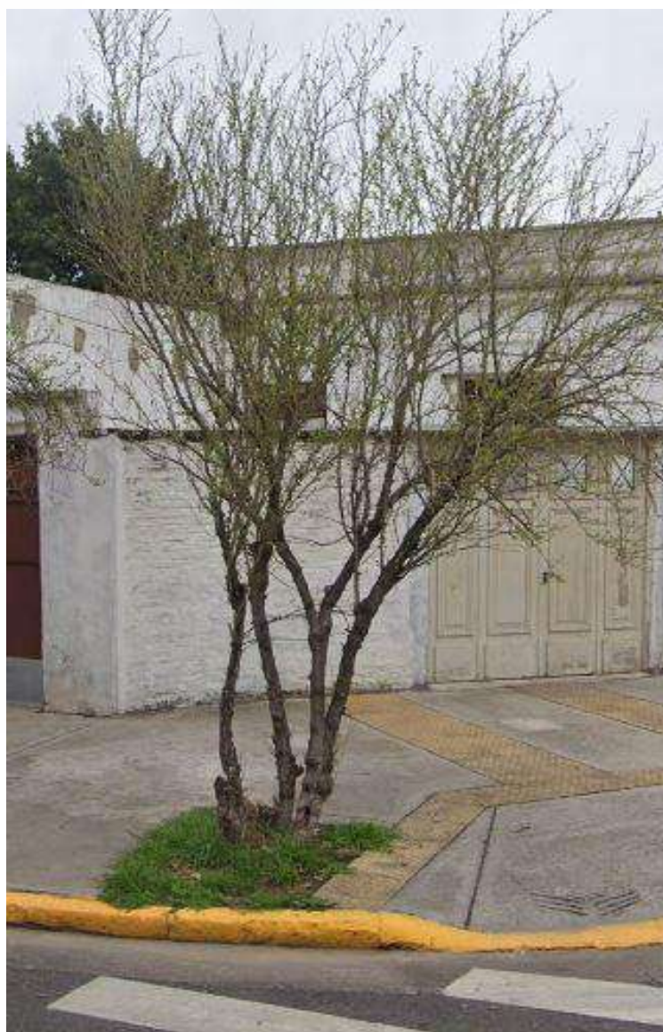
IMAGEN DEL EJEMPLAR