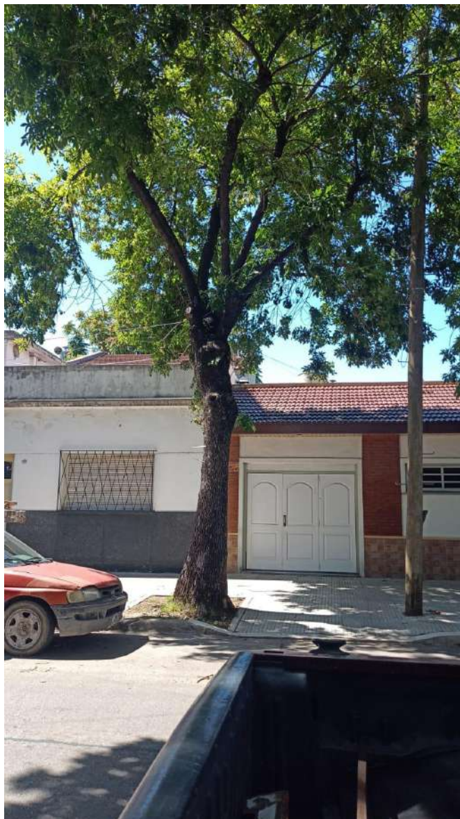
IMAGEN DEL EJEMPLAR