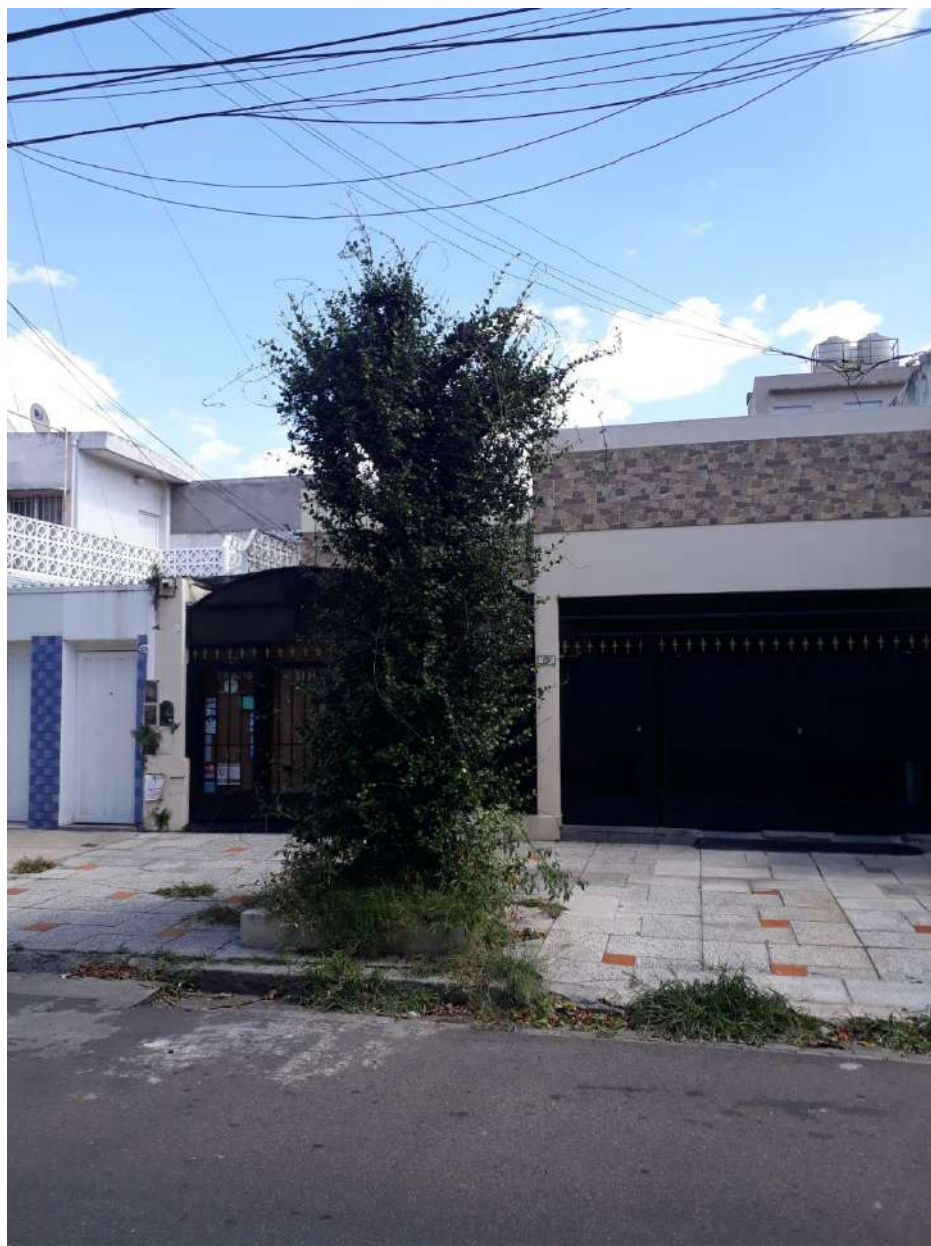
IMAGEN DEL EJEMPLAR