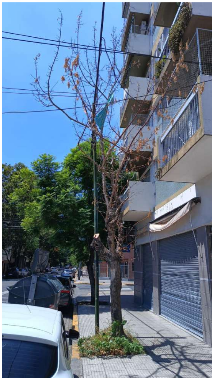
IMAGEN DEL EJEMPLAR