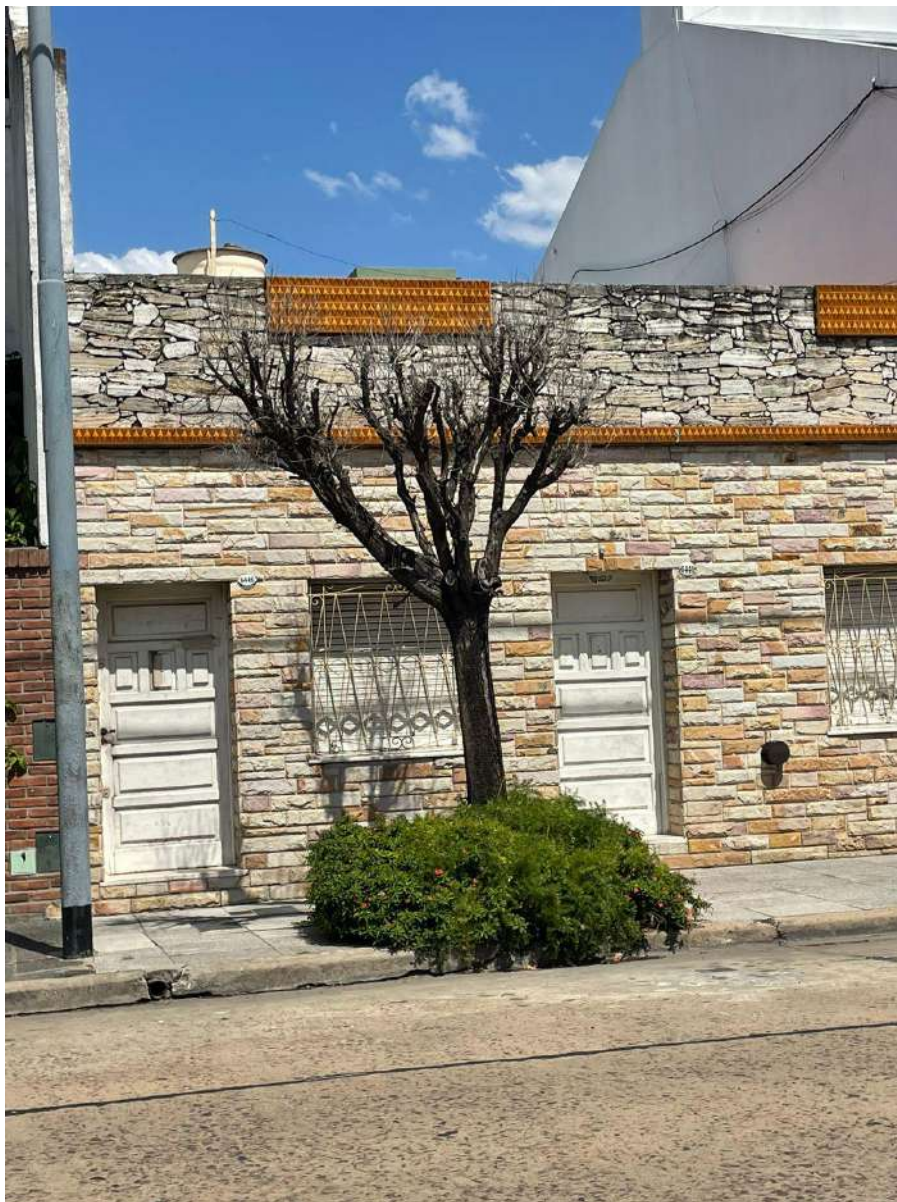
IMAGEN DEL EJEMPLAR