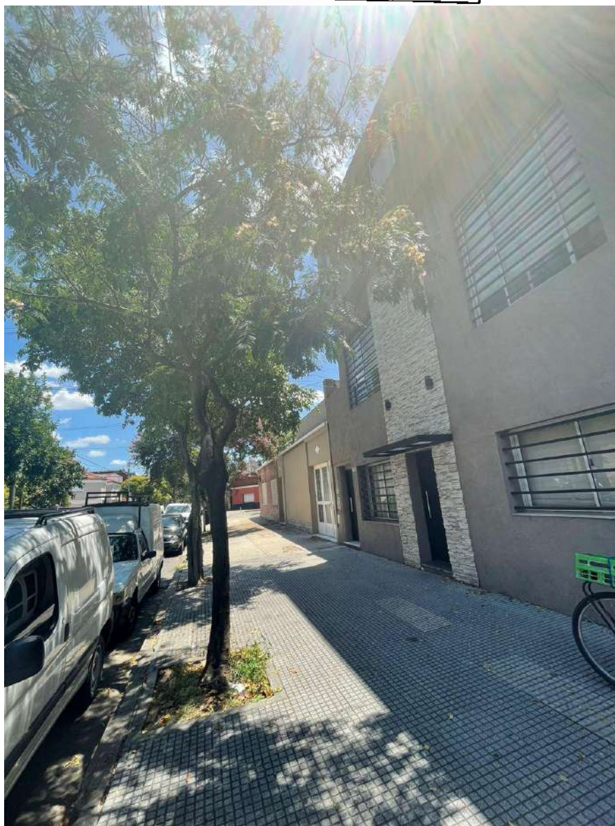
IMAGEN DEL EJEMPLAR