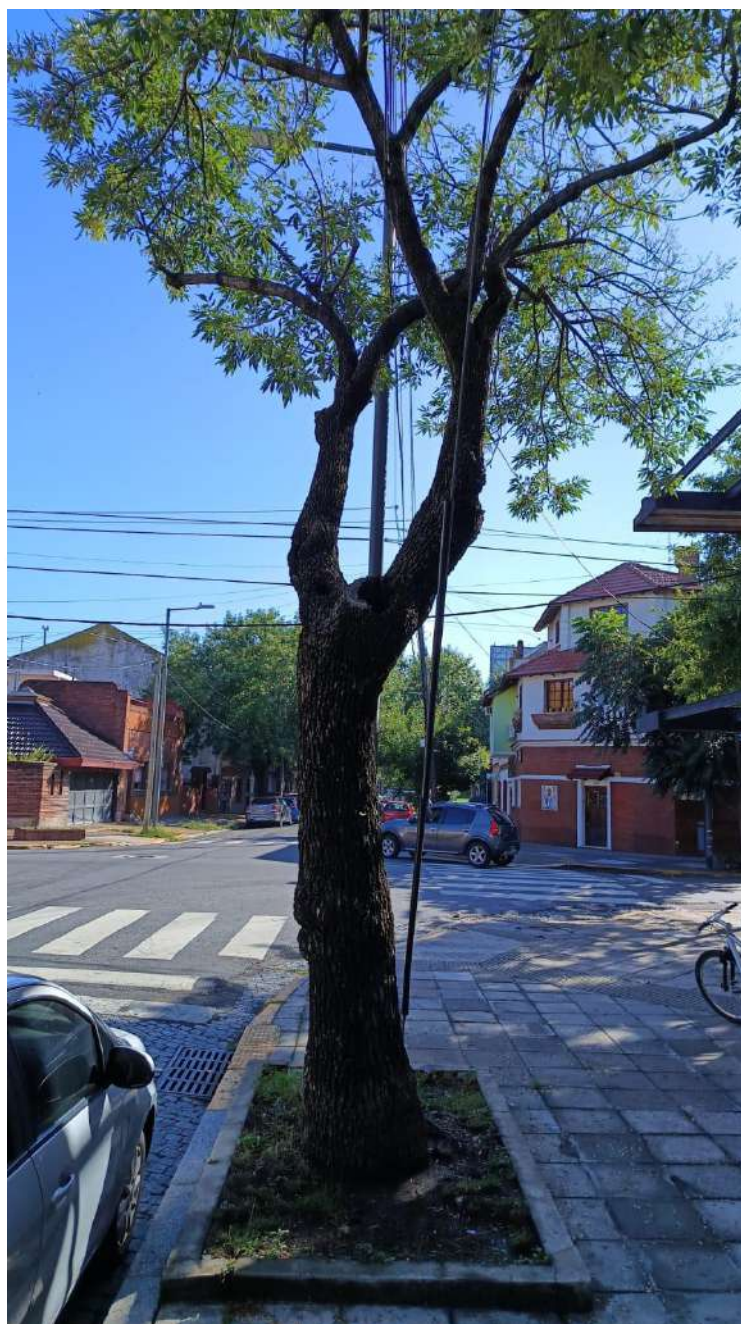
IMAGEN DEL EJEMPLAR

Calle RECUERO, CASIMIRO, TTE. CNEL. 3406