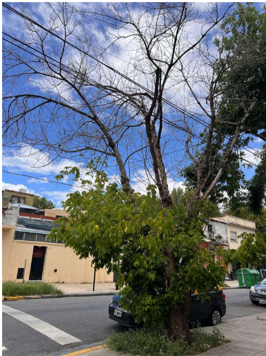
IMAGEN DEL EJEMPLAR