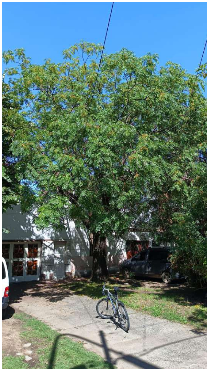
IMAGEN DEL EJEMPLAR