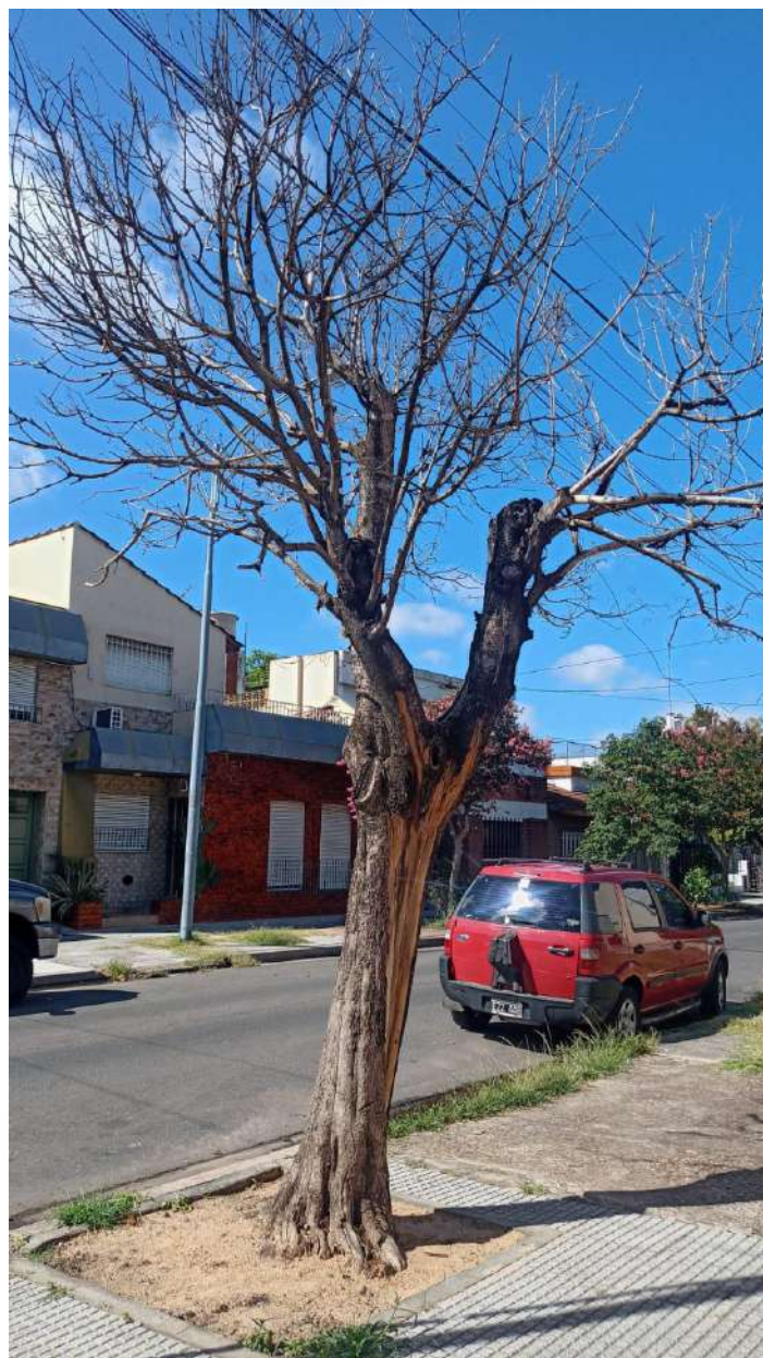
IMAGEN DEL EJEMPLAR