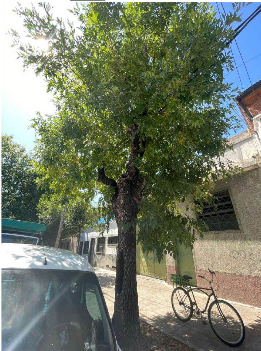
IMAGEN DEL EJEMPLAR