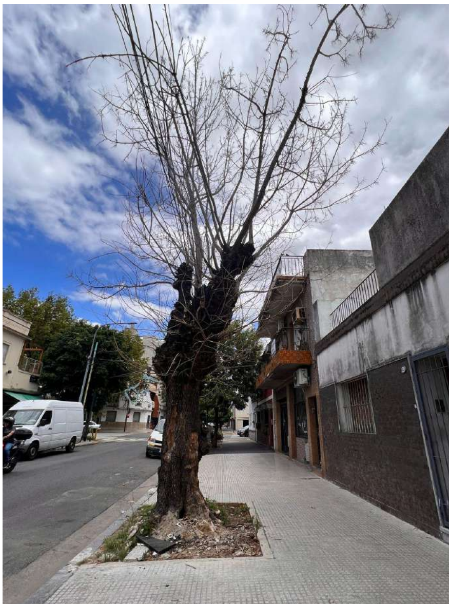
IMAGEN DEL EJEMPLAR