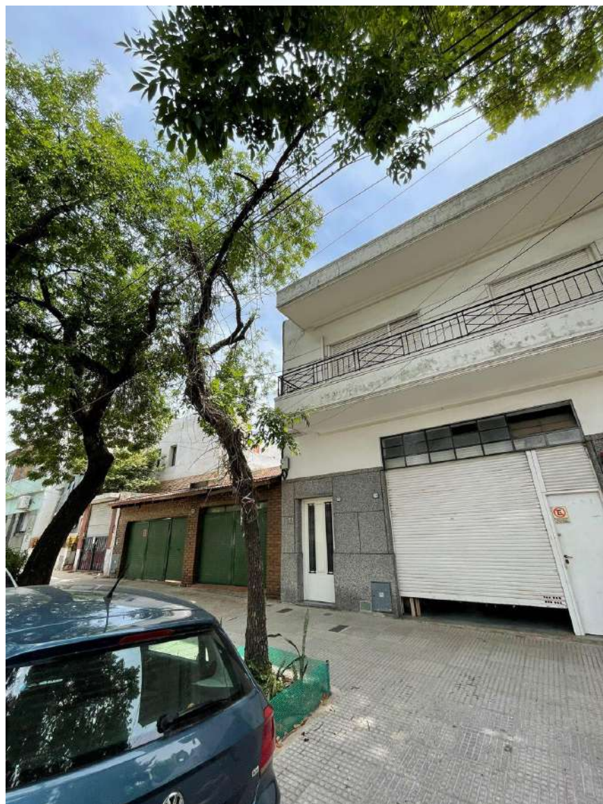
IMAGEN DEL EJEMPLAR