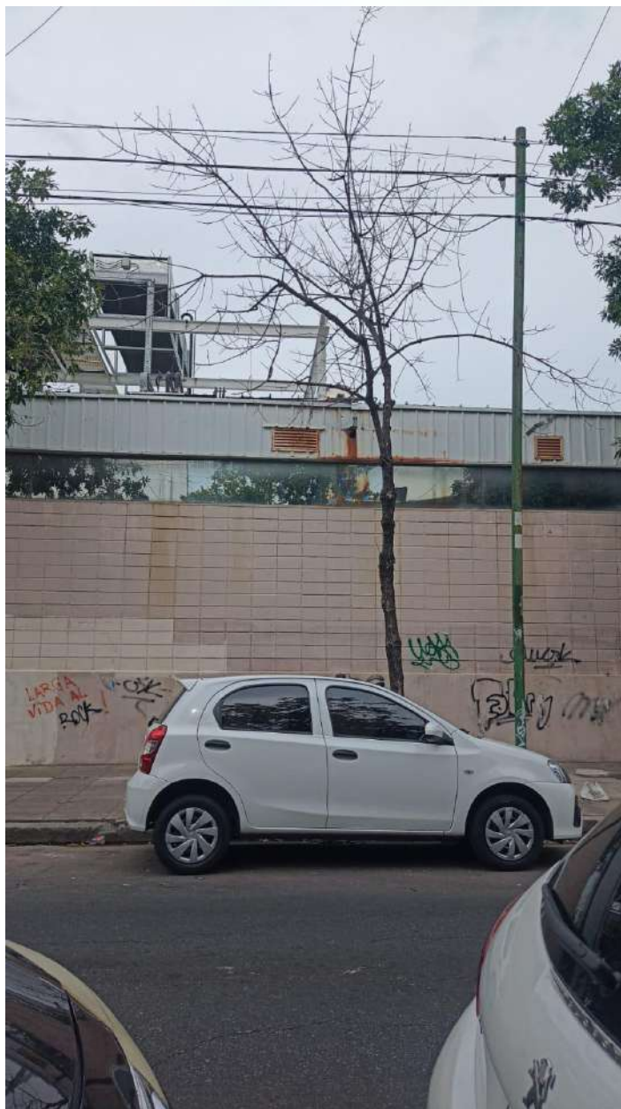
IMAGEN DEL EJEMPLAR