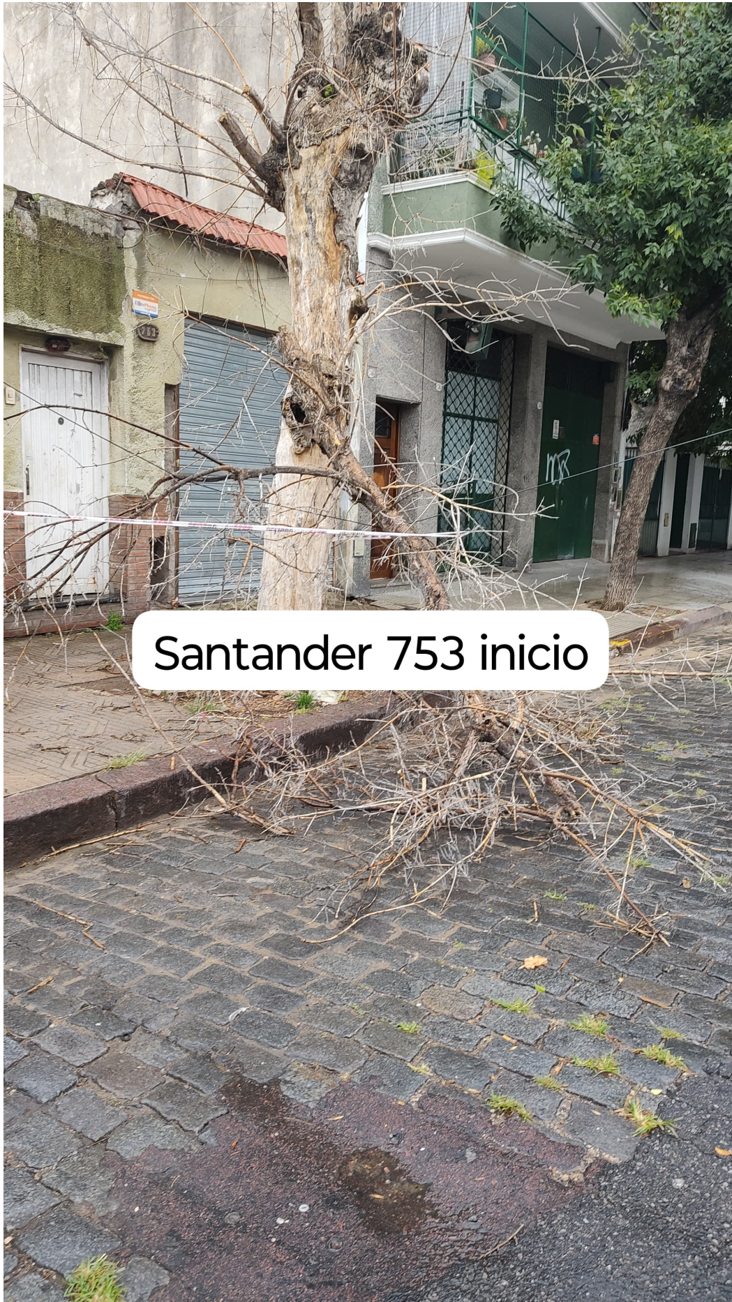
Santander 753 inicio