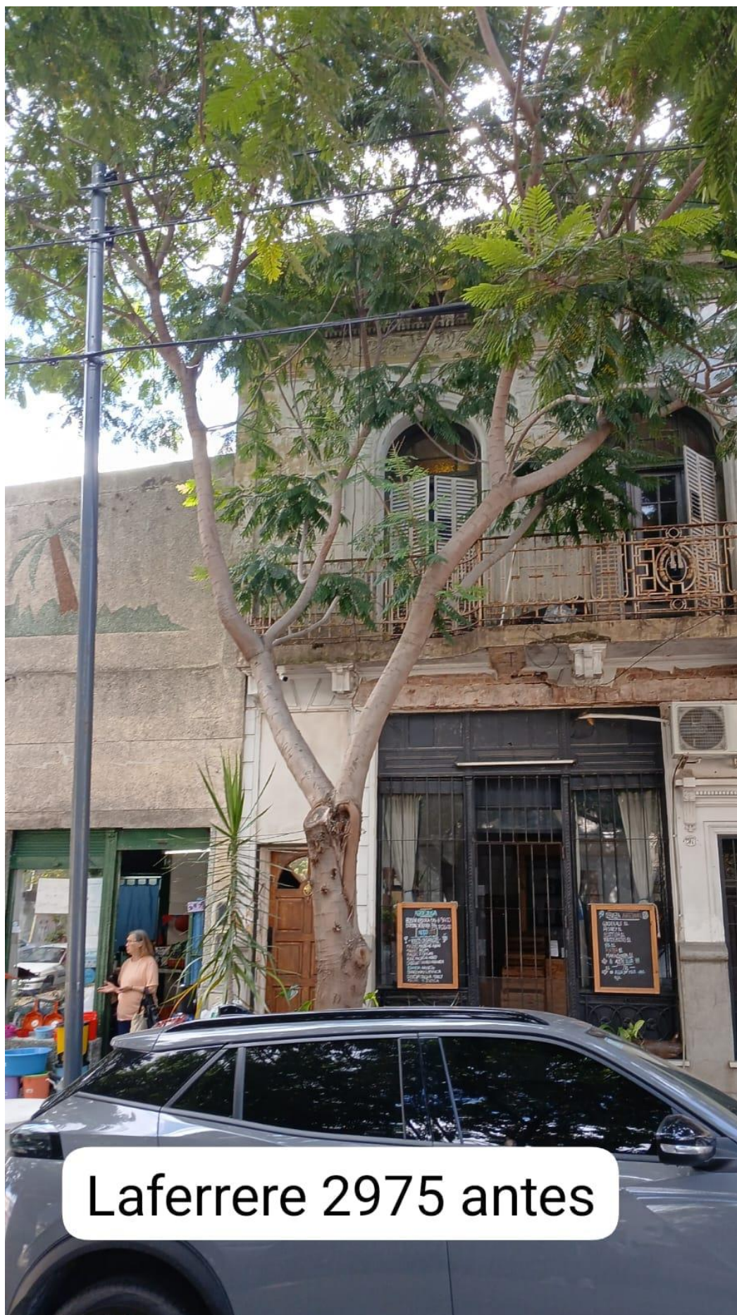
LaFerrere 2975 antes