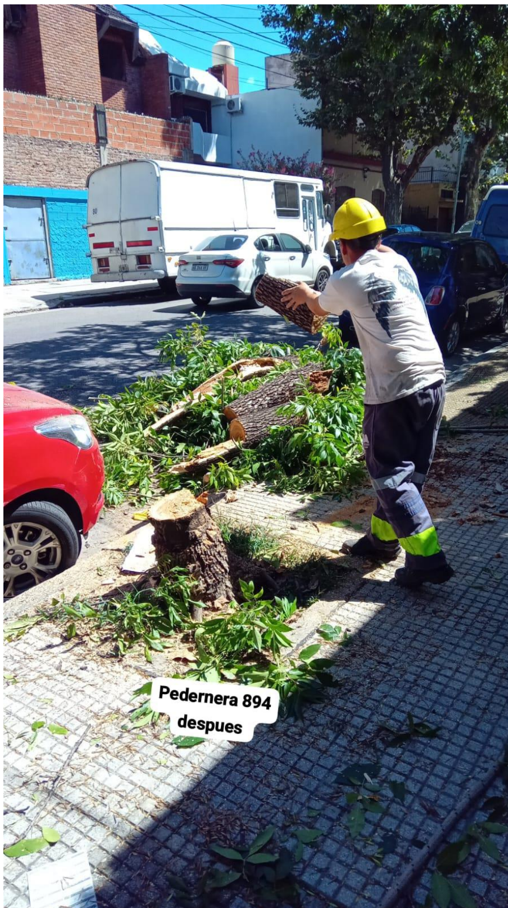
Pedernera 894 despues