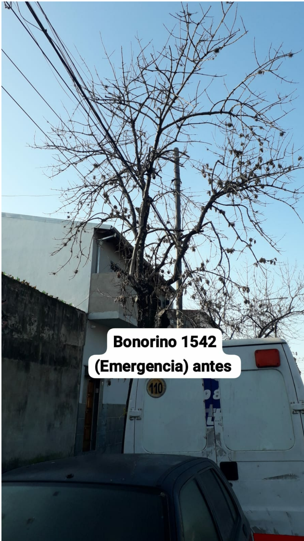
Bonorino 1542 (Emergencia) antes