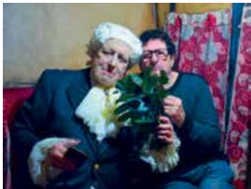
← Marco Bellocchio.

El realizador italiano es homenajeado con un ciclo que presenta ocho de sus largometrajes.