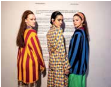
© - De Miracolo / Alberto Brescia