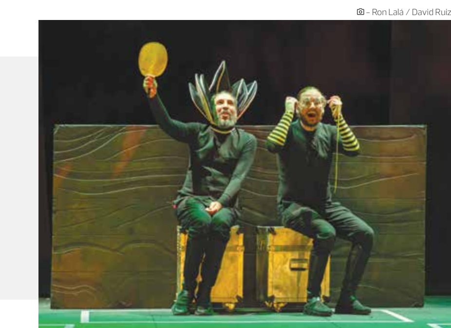
© - Ron Lalá / David Ruiz

Nina se construyó un cubo, se metió adentro y decidió no salir más. Una pieza que habla de la soledad y de la amistad, del miedo y del valor que requiere ir hacia aquello que anhelamos. Una obra de teatro de títeres y teatro físico, creada espe-