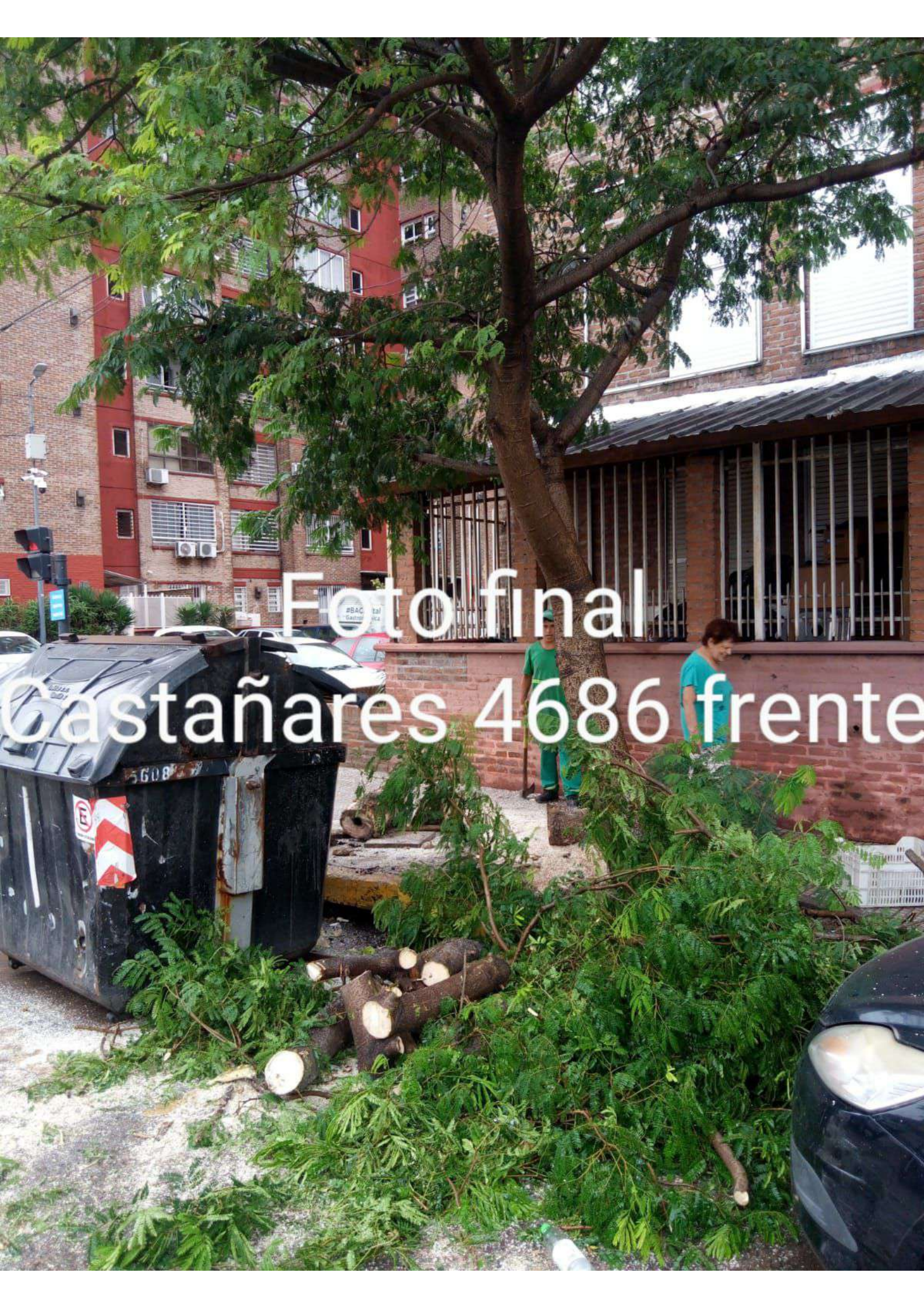
Foto final Castañares 4686 frente