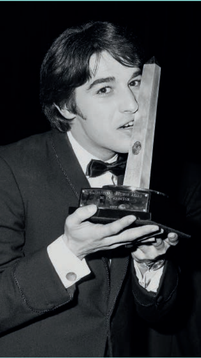
Primer Festival Buenos Aires de la Canción (1967)

Roberto Sánchez, cantante, compositor, actor, productor y director argentino nacido en Buenos Aires el 19 de agosto de 1945. Pionero del rock nacional y emblema de la música romántica.