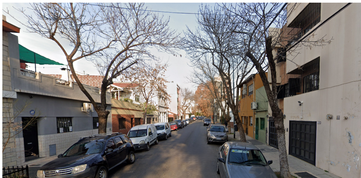
FOTO - CORREDOR ANTES