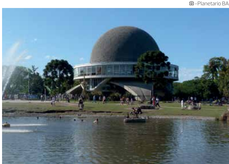
@ - Planetario BA