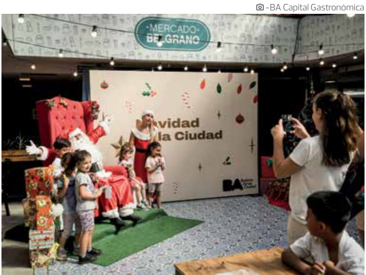
BA Capital Gastronómica