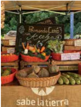
Sabe la Tierra. Edición navideña de la feria que promueve la sustentabilidad.