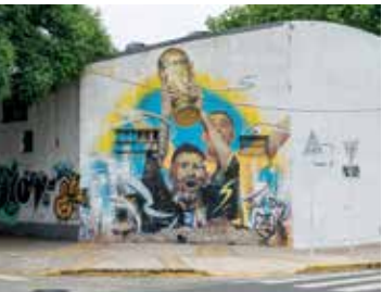
📍 -María Paula Pia

- El gesto desafiante de Messi durante el partido contra Países Bajos reinterpretado con estética barrial que se luce en pleno casco histórico.