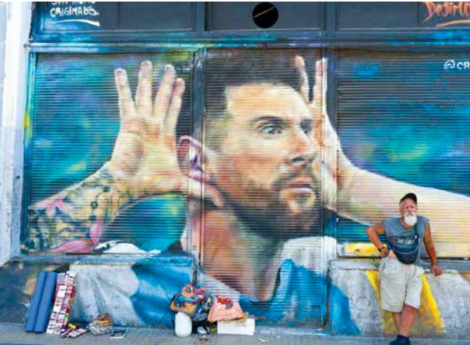
📍 -Magdalena Ahmar Dakno

- El instante más tenso de la final de Qatar, en el partido contra Francia, convertido en imagen urbana.