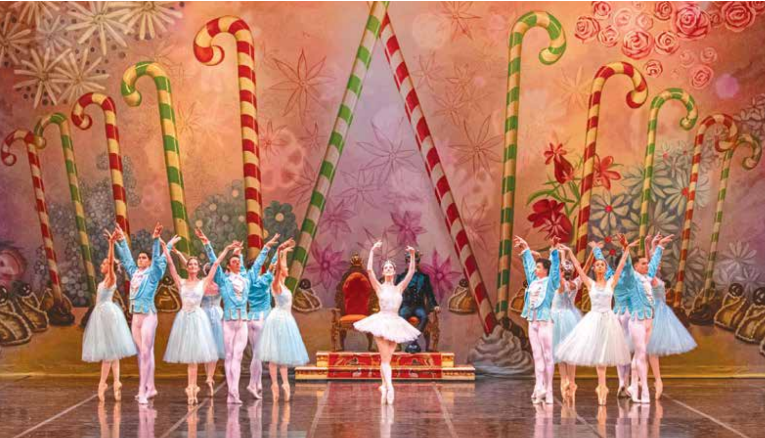
Teatro Colón / Carlos Villamayor

El Teatro Colón transita el cierre de una exitosa temporada 2025, marcada por el centenario de sus elencos estables y por una intensa programación artística que se despliega durante diciembre. En paralelo, y ante la buena recepción del público, inició la venta y renovación de abonos para la temporada 2026, que ya pueden adquirirse de lunes a viernes, de 9 a 16.45, en Libertad 621, con turno previo o también de forma digital, en www.teatrocolon.org.ar , con el beneficio de hasta 10 cuotas sin interés con Banco Ciudad.