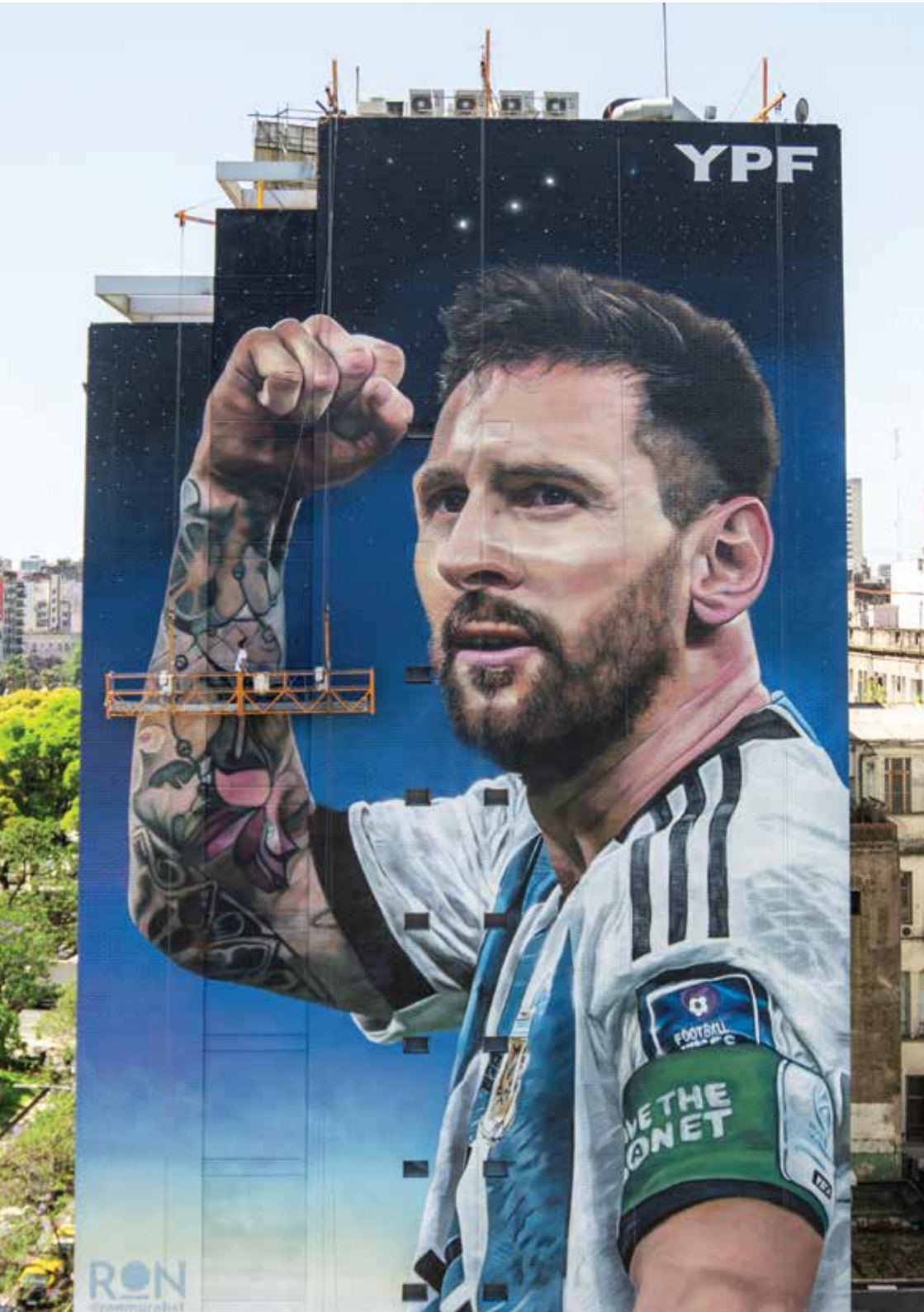
📍 -Martín Ron (@ronmuralist)

- Messi celebra victorioso, en una de las postales más imponentes del circuito mundialista porteño.