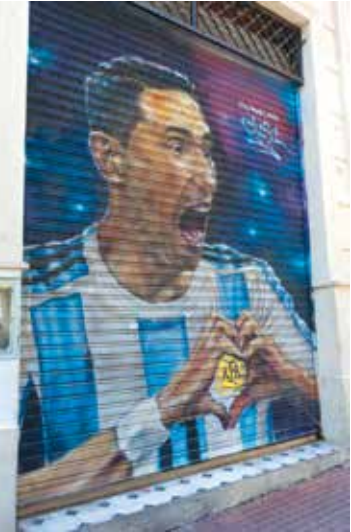
📍 -Magdalena Ahmar Dakno

- El capitán de la Selección levanta la Copa en una de las esquinas más fotografiadas del circuito.