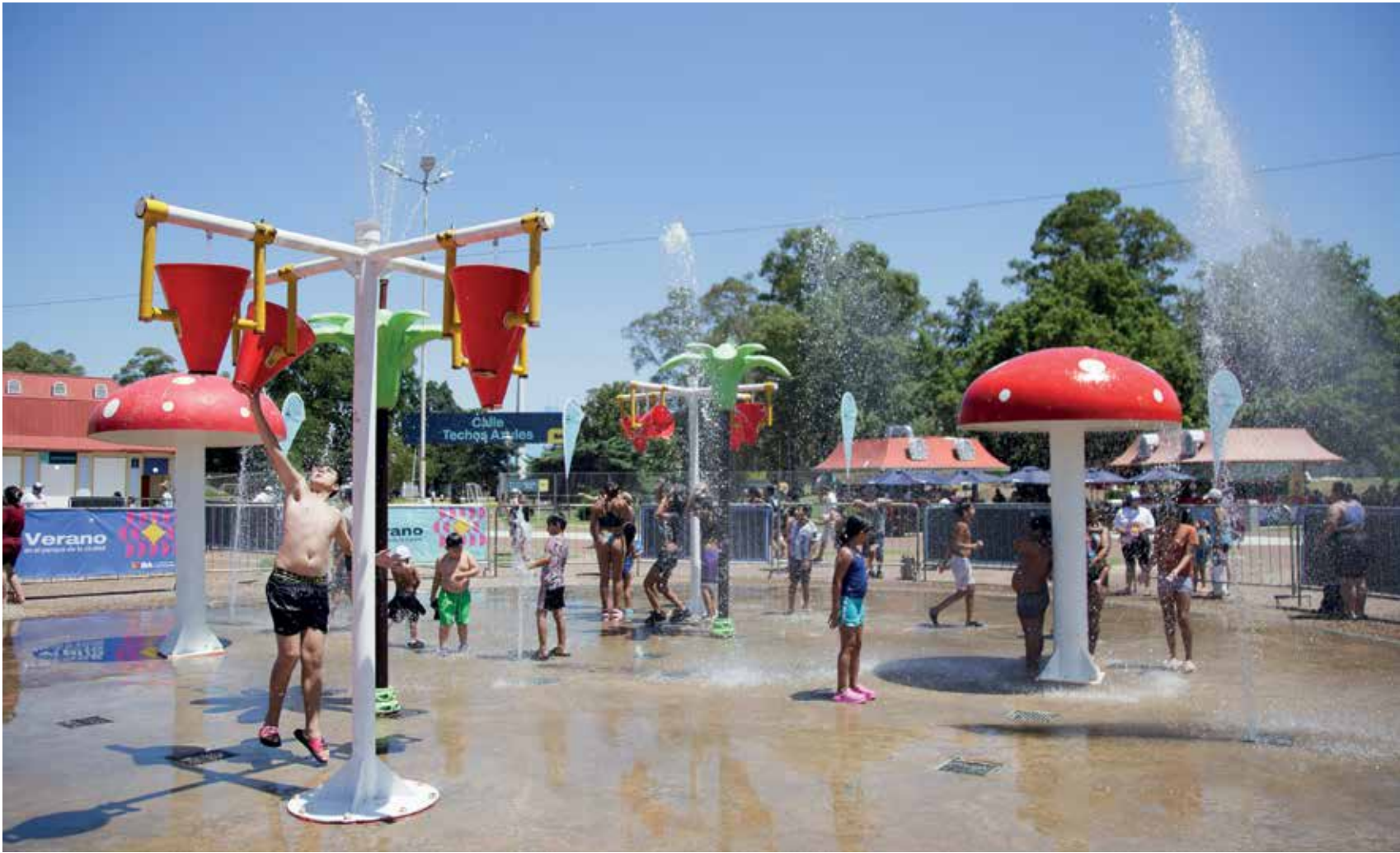
@-GCBA / Ariel García G.