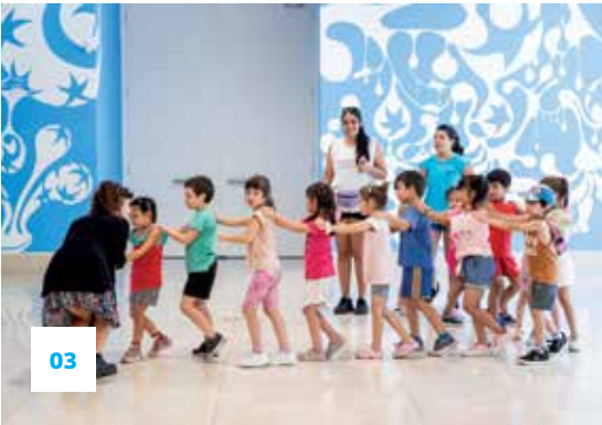
© -El Moderno / Guido Limardo