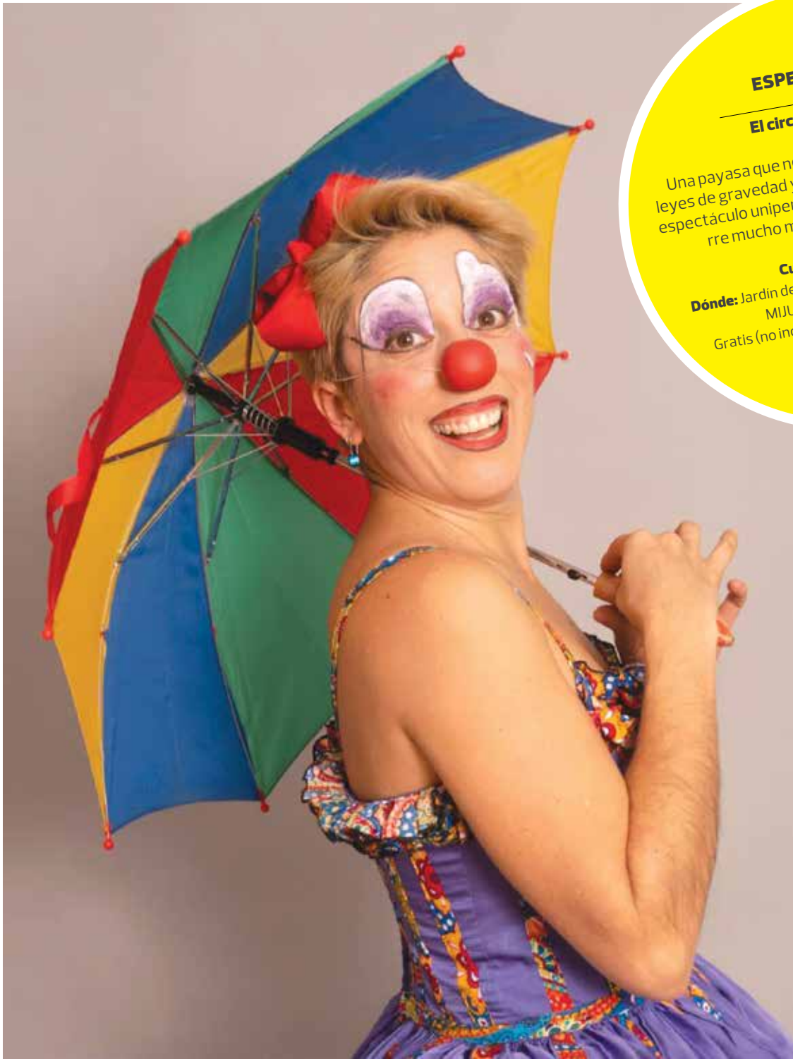
@ - GCBA

Cuándo: domingo 8, 18 h. Dónde: E.C. Chacra de los Remedios.