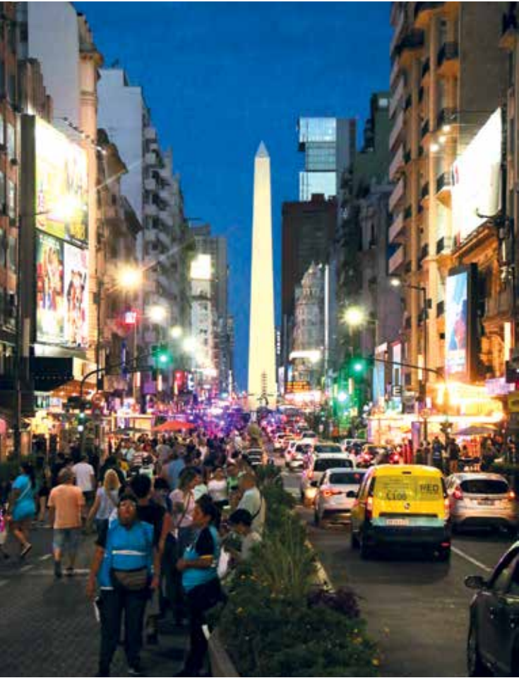
GCBA / Desarrollo Económico

Afters BA. El ciclo para cambiar de sintonía al salir del trabajo se instala el miércoles 11, en Villa Urquiza.