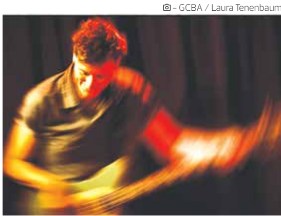
GCBA / Laura Tenenbaum

Artistas. DJ Villa Diamante y Javier Malosetti se presentan en distintos escenarios al aire libre el sábado 7.