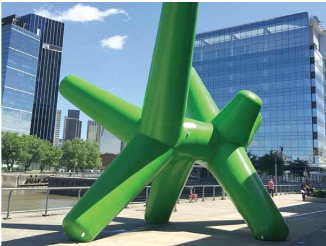
Las actividades contribuyen a posicionar al diseño argentino a nivel internacional

Además, desde el jueves 27 y hasta el sábado 29 se celebrará la 10° edición del FID, Festival Internacional de Diseño en el CMD, con