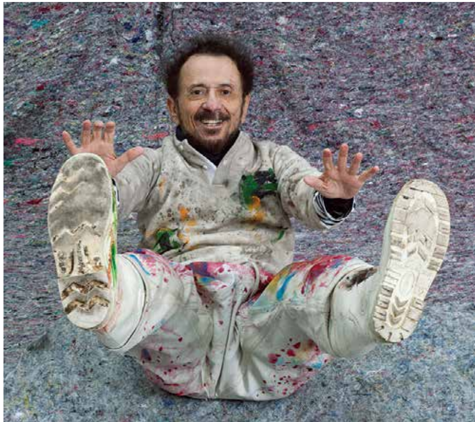
Tom Zé vuelve a la Argentina después de 15 años y se presenta en La Usina este fin de semana.