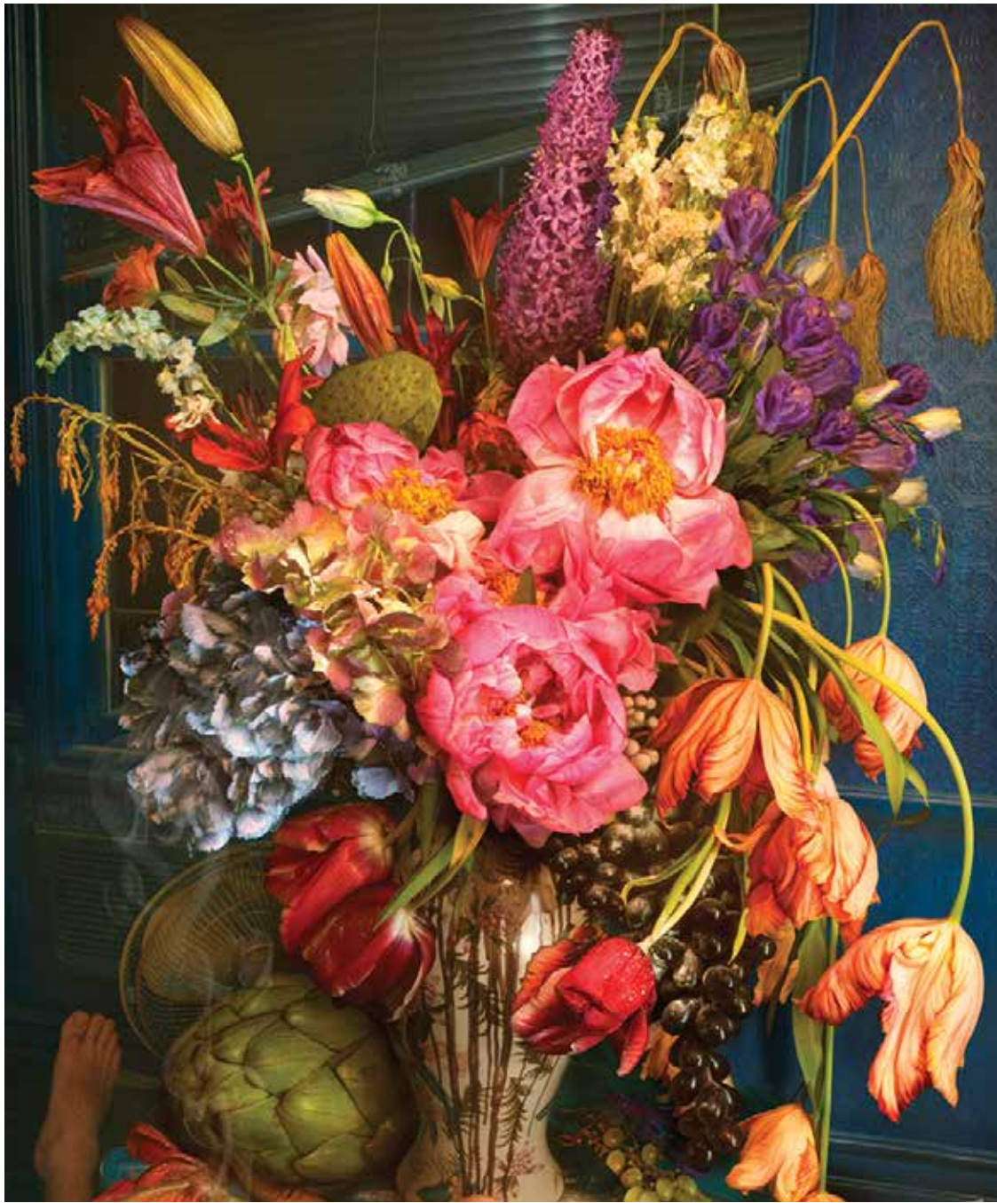
Flores, de LaChapelle.