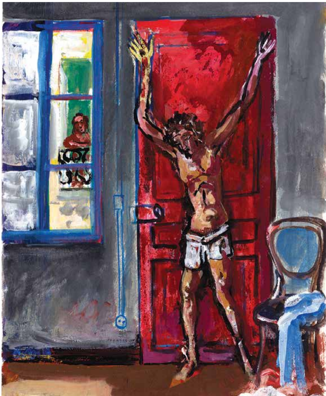
Una de las 200 obras de Berni expuestas en el Museo de Arte Moderno