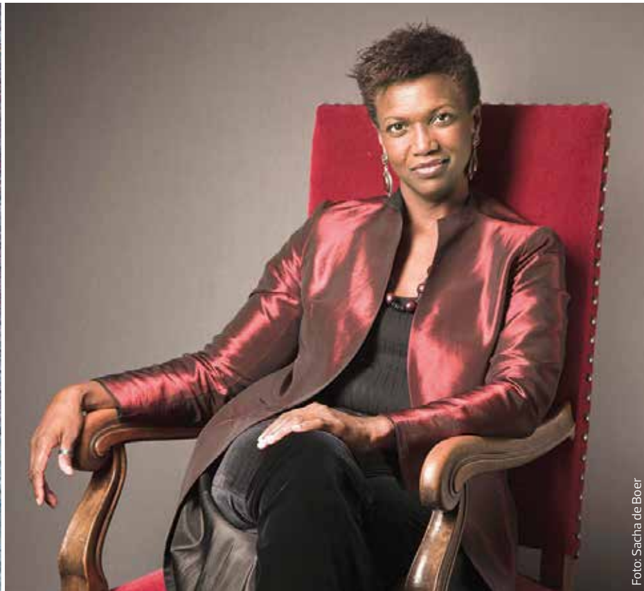
La cantante norteamericana Claron McFadden inaugura el ciclo de Música Contemporánea