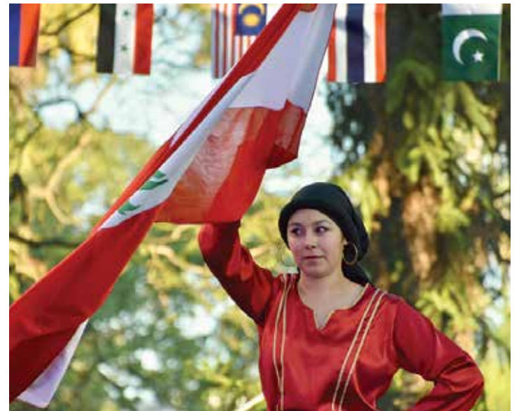
La colectividad del Líbano se despliega en Avenida de Mayo y Bolívar.