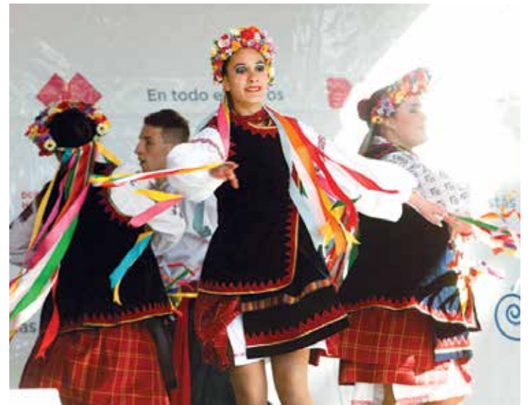
El sábado 29, la tradición ucraniana se celebra en el Parque Tres de Febrero.

y productos típicos de esta colectividad. Se podrán encontrar los platos típicos como el Kibbeh, albóndigas hechas de carne con cebolla y piñones; el Kofta, cordero asado al carbón y el conocido Tabule "tabbouli", ensalada con hojas de la menta y del perejil. En cuanto a los espectáculos, se podrá disfrutar del talento de los ballets Al Mala Ihah, Por Amor al Dabke, la Escuela de Danzas Orientales de Nadia Jattar y el ballet de Firqat Amioun entre otros.