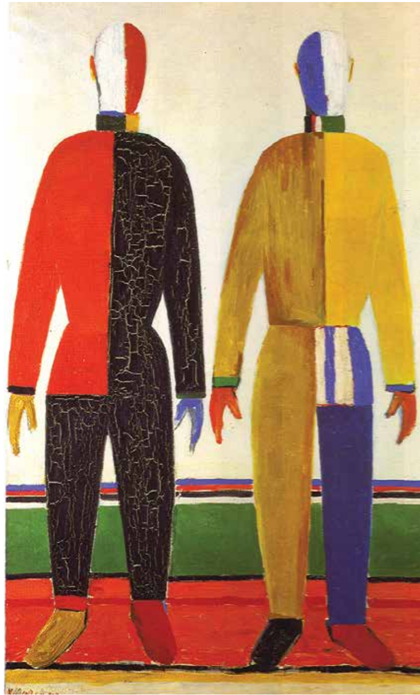
Deportistas, 1930-1931. Col. State Russian Museum, de Kazmir Malevich, puede verse en la