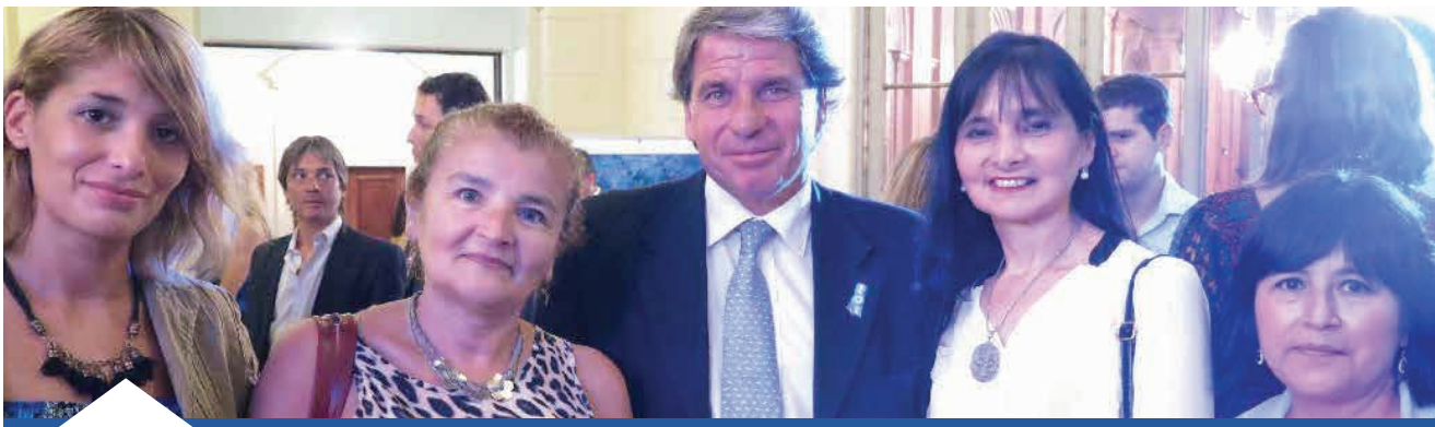
Procurador General de la Ciudad y cursantes de las Carreras de Estado de la PG CABA