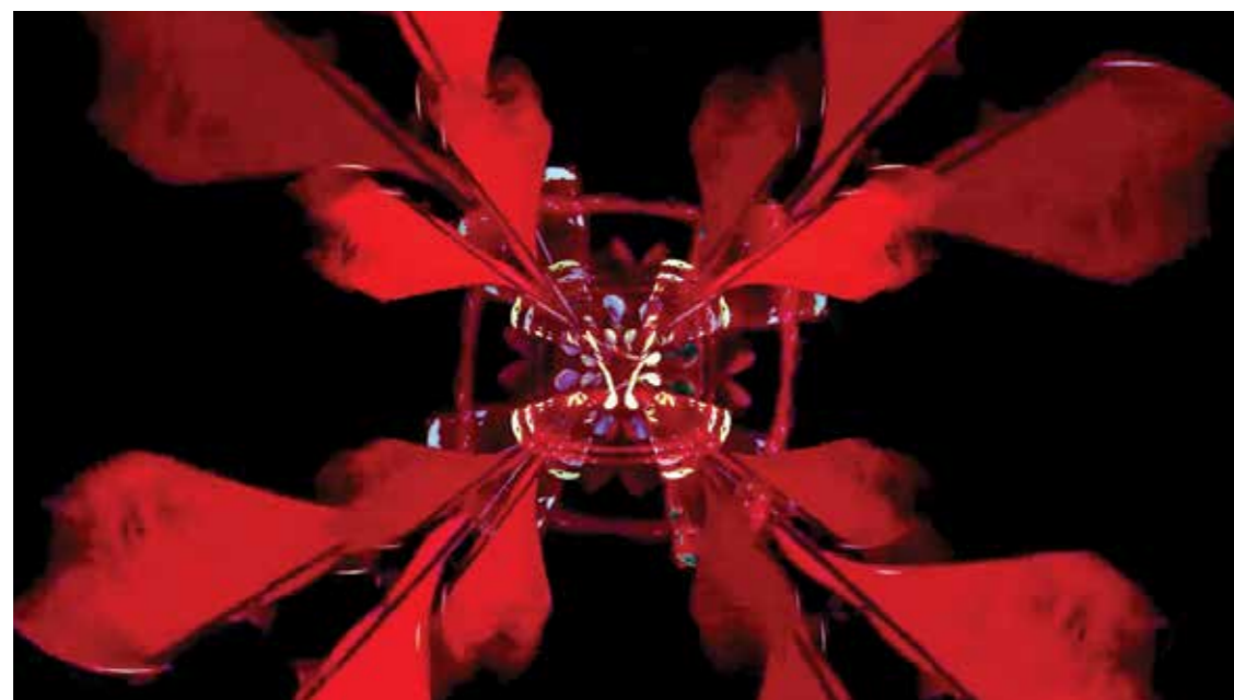
Los hechos ineludibles de la historia, instalación de Carlos Trilnick.

por el artista Joaquín Fargas en homenaje al maestro Kosice. Por su parte, con la instalación Los hechos ineludibles de la historia , el reconocido artista Carlos Trilnick indaga sobre las ideologías como parte ineluctable del devenir humano en la historia, y consecuentemente, la crisis del "fin de las ideologías". La obra plantea un escenario donde la puesta en escena es mediatizada por robots controlados por computadora, instalaciones robóticas interactivas, videoesculturas e instalaciones lumínicas interactivas, entre otras expresiones de vanguardia del siglo XXI, a las que se suma una obra de Bioarte especialmente realizada