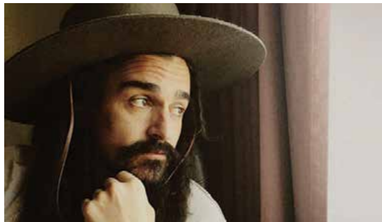
Dread Mar I estrena su nuevo disco “Diez años”.

Música de Rosario presenta “De brujos, esqueletos y corcheas”, una propuesta didáctico-musical para toda la familia, con un repertorio de canciones nacionales y universales, folklóricas y populares así como también obras vocales e instrumentales de la Edad Media y el Renacimiento.