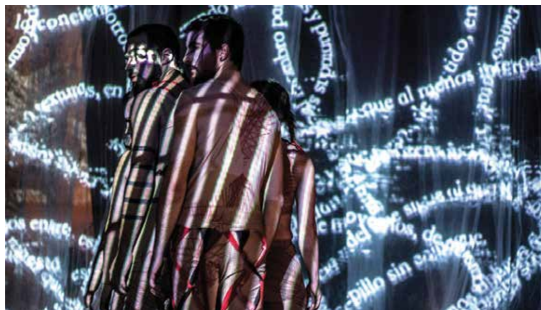
La Red-Odisea Cognitiva parte de un encuentro teatral que integra acrobacia, música en vivo, poesía y artes multimediales.