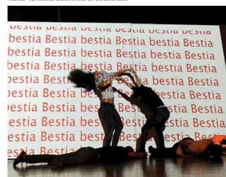
Instructivo, un diálogo y una construcción colectiva en tiempo real.

duino, pasando por sensores digitales, analógicos y control de un servo, que a pesar de sus nombres técnicos no exigen conocimientos previos. El Taller de Video Mapping e interfaces inalámbricas , por su parte, se propone brindar los conocimientos y recursos necesarios para proyectar imágenes o animaciones sobre diferentes soportes, aprovechando sensores inalámbricos para controlar distintos parámetros. Interesado por la unión entre las artes escénicas y la exploración de soportes digitales, Noviembre Electrónico presenta además el work in progress de El empapelado amarillo , con dirección de Sebastián Kalt, a partir del relato homónimo de Charlotte Perkins. Confinada al ático de la extraña casona que su marido ha alquilado para que se recupere de lo que entiende es una depresión nerviosa temporaria, Anna enfoca su atención sobre el enervante empapelado que revisita las paredes de la habitación. Su patrón no parece responder a ninguna ley de diseño y es de un amarillo de lo más extraño, un amarillo que remite a cosas viejas, repugnantes, malignas. Poco a poco, este comenzará a ejercer una peligrosa fascinación sobre ella que la empujará hasta el límite de su ser.