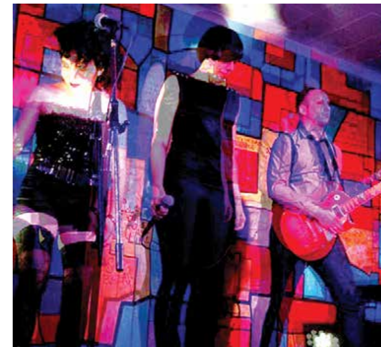
Nexus-6, música electrónica en Sótano Lab.

duino, pasando por sensores digitales, analógicos y control de un servo, que a pesar de sus nombres técnicos no exigen conocimientos previos. El Taller de Video Mapping e interfaces inalámbricas , por su parte, se propone brindar los conocimientos y recursos necesarios para proyectar imágenes o animaciones sobre diferentes soportes, aprovechando sensores inalámbricos para controlar distintos parámetros. Interesado por la unión entre las artes escénicas y la exploración de soportes digitales, Noviembre Electrónico presenta además el work in progress de El empapelado amarillo , con dirección de Sebastián Kalt, a partir del relato homónimo de Charlotte Perkins. Confinada al ático de la extraña casona que su marido ha alquilado para que se recupere de lo que entiende es una depresión nerviosa temporaria, Anna enfoca su atención sobre el enervante empapelado que revisita las paredes de la habitación. Su patrón no parece responder a ninguna ley de diseño y es de un amarillo de lo más extraño, un amarillo que remite a cosas viejas, repugnantes, malignas. Poco a poco, este comenzará a ejercer una peligrosa fascinación sobre ella que la empujará hasta el límite de su ser.