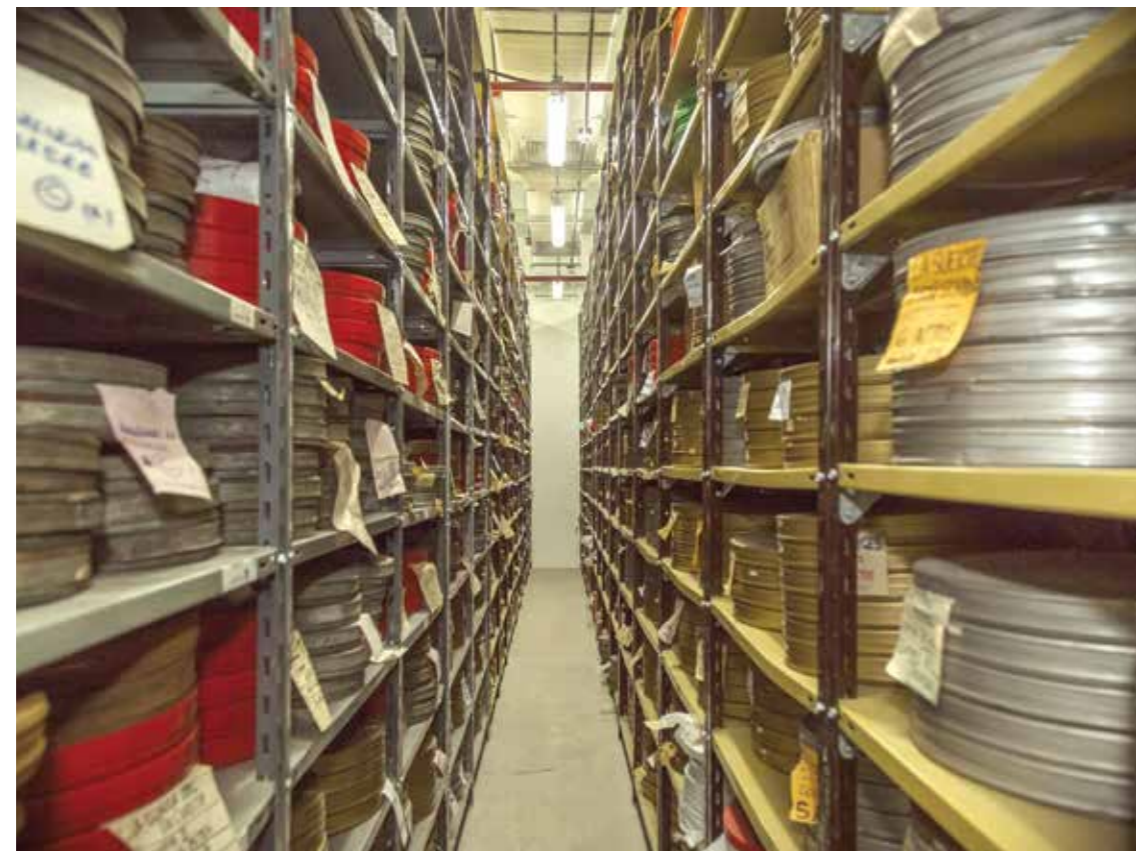
Actualmente el museo trabaja para digitalizar su archivo documental, filmico y fotográfico.