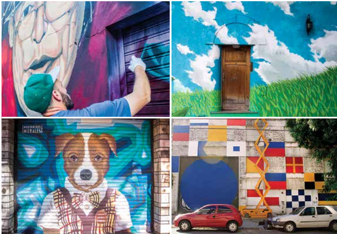
Más de 30 artistas argentinos intervinieron fachadas de casas y edificios en el barrio de Bajo Belgrano.