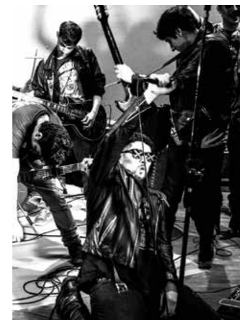
The Charlie's Jacket tocará en Sótano Beat