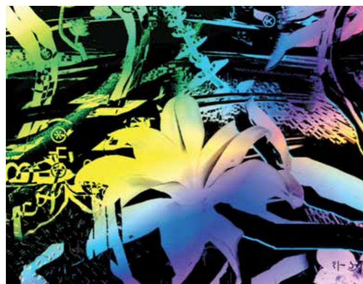
Música electrónica con Zoelandia

Dentro del menú de Exhibiciones, ocupan un lugar destacado las obras ganadoras de la IV edición de la Bienal Kosice, bautizada en honor del artista argentino recientemente fallecido Gyula Kosice. Se trata de obras de arte con desarrollo tecnológico que hablan de un porvenir esperanzador, contemplan el cuidado del medio ambiente y protegen los recursos naturales. En esta oportunidad, inspirándose en el texto "La obra abierta y los nuevos mitos del arte", escrito por Kosice en 1994 con motivo de su encuentro con Umberto Eco, la Bienal convocó a los artistas a crear proyectos artístico-tecnológicos que desafiaran la libertad creativa y la imaginación, sorteando los desafíos suscitados por las nuevas tecnologías y la ciencia: la robótica, la artificialidad, la realidad virtual, el bioarte, etcétera. Entre otras obras, en esta oportunidad podrán verse maquetas electrónicas mixtas controladas por computadora, instalaciones robóticas interactivas, videoesculturas e instalaciones lumínicas interactivas, entre otras expresiones de vanguardia del siglo XXI, a las que se suma una obra de Bioarte especialmente realizada