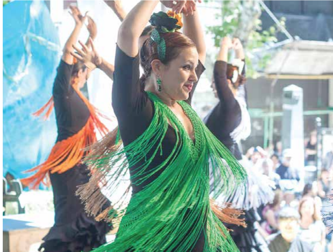
Los bailes andaluces serán parte de los espectáculos del domingo 13 de noviembre

Y el domingo 13 de noviembre la tradicional avenida porteña recibirá a las colectividades españolas, para una fiesta a puro baile y tradición. La jornada comenzará a