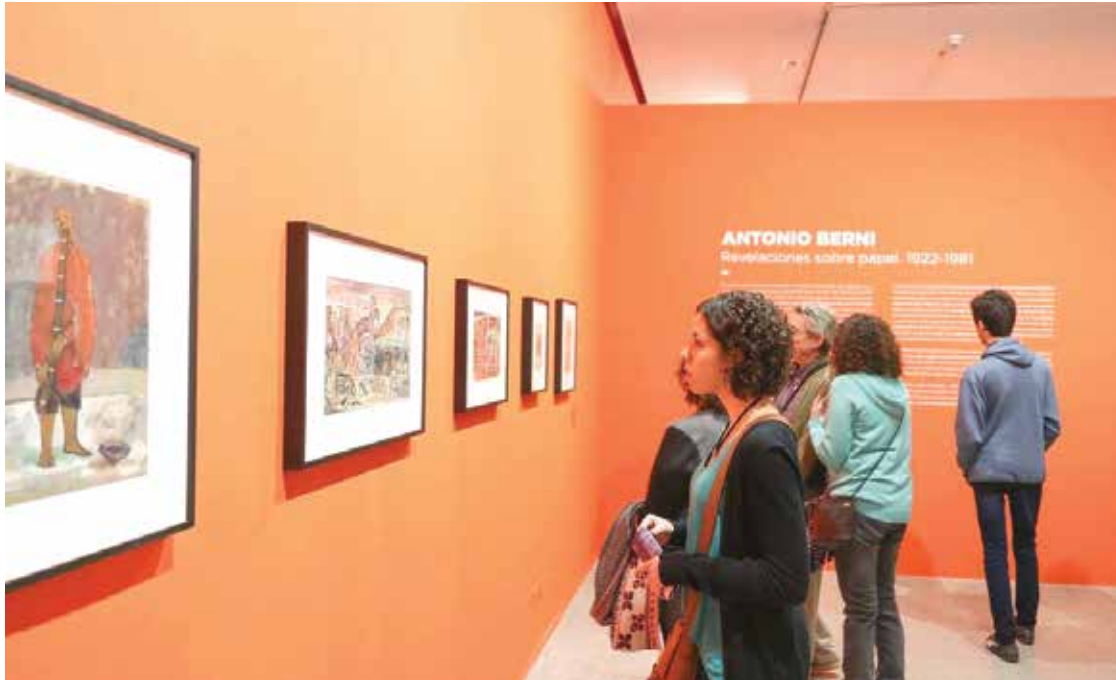
El MAMBA expone dibujos inéditos de Antonio Berni

festivales.buenosaires.gob.ar Del 23 al 28 de noviembre se realizará el Festival Internacional Buenos Aires Jazz, que permite vivir y explorar el género a través de las novedades locales e internacionales. Durante las distintas jornadas habrá numerosos conciertos, cruces inéditos, ensambles acústicos y encuentros pedagógicos que invitan a disfrutar de un género único como el jazz.