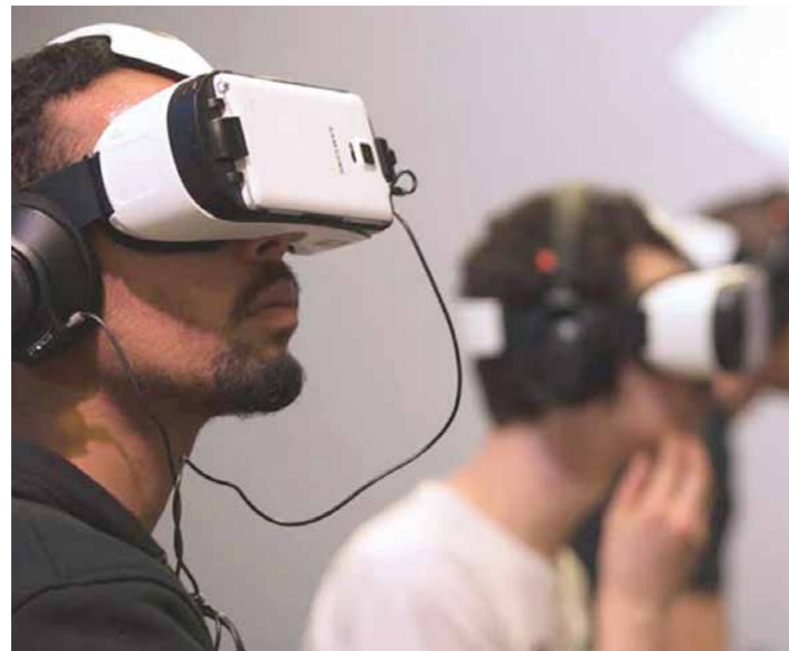
En la Noche de la Realidad Virtual se podrán probar los últimos desarrollos y tecnologías en realidad virtual.