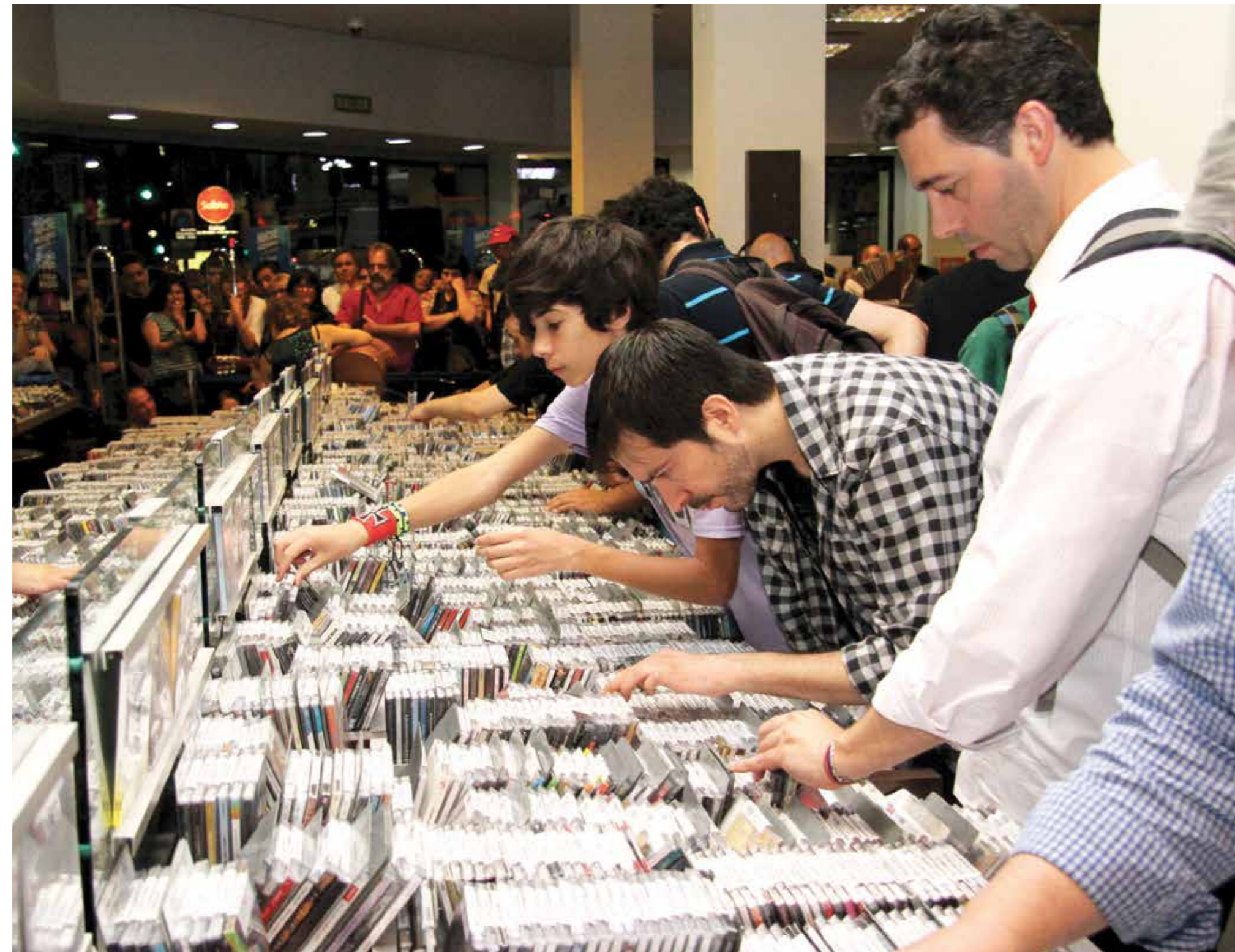
El jueves 10 habrá descuentos y promociones en la venta de música en disquerías de distintos barrios porteños.