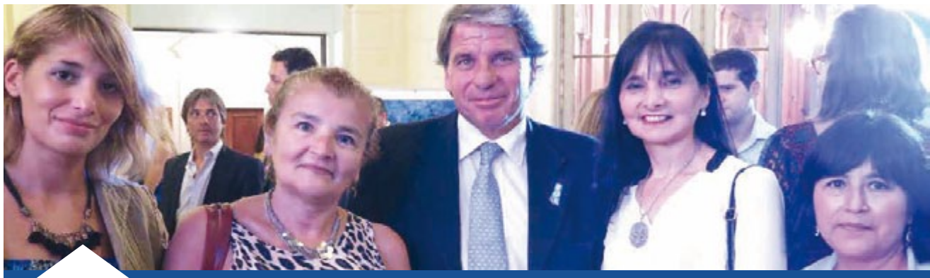
Procurador General de la Ciudad y cursantes de las Carreras de Estado de la PG CABA