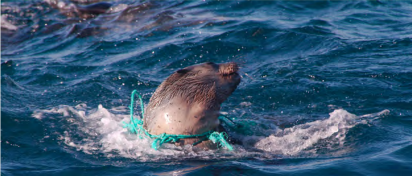
Lobo marino con un suncho de plástico alrededor.

El plástico es un material barato y liviano que tiene muchos usos. Los océanos están llenos de plásticos, el 80% de los residuos que encontramos en el mar son residuos terrestres y no marinos.