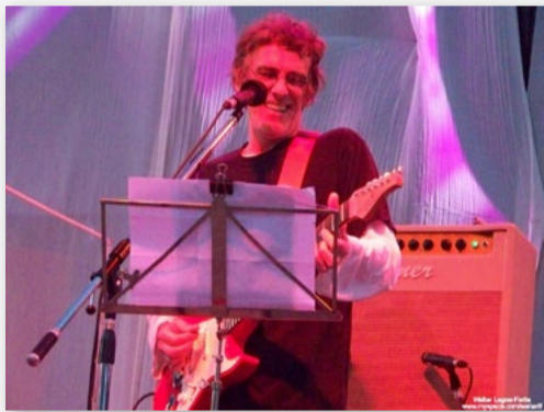
Luis Alberto Spinetta.