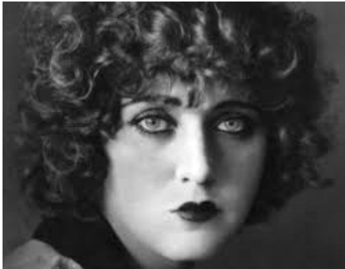
Carmen Mondragón "Nahui Ollín"

Como todos los años, la ofrenda a realizarse en el Museo Fernandez Blanco el viernes 2 de noviembre de 2018, estará dedicada a un personaje ilustre mexicano y a otro de nacionalidad argentina, para honrar a los difuntos de ambos países y celebrar junto con los visitantes argentinos nuestra riqueza cultural. Por México, la homenajeada será la artista Carmen Mondragón "Nahui Ollín" y Alfonsina Storni por Argentina.