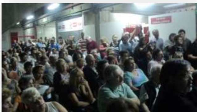
Asociación Atlética Argentinos Jrs.