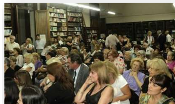
Biblioteca de Devoto