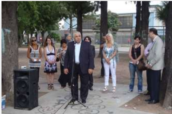
Plaza Pte. Roque Sáenz Peña